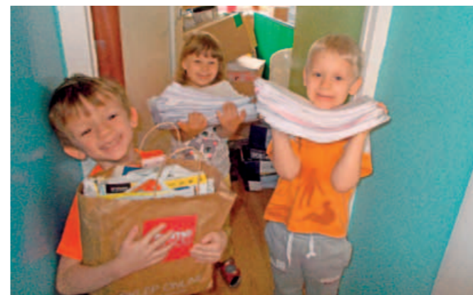
Przedszkole Miejskie nr 171 w Łodzi