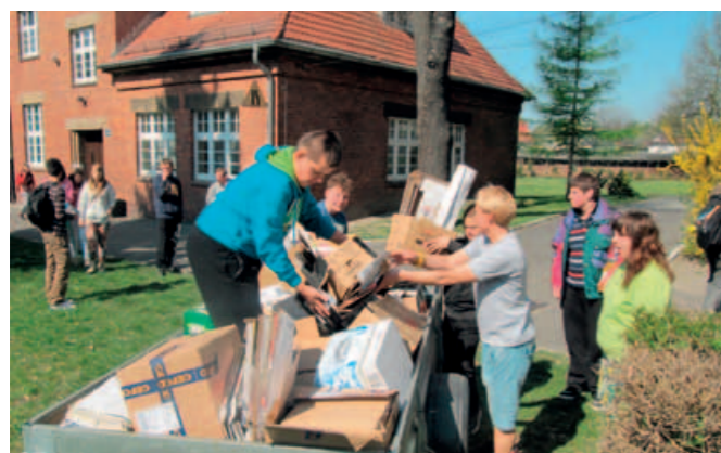
Zespół Szkół nr 18 w Warszawie