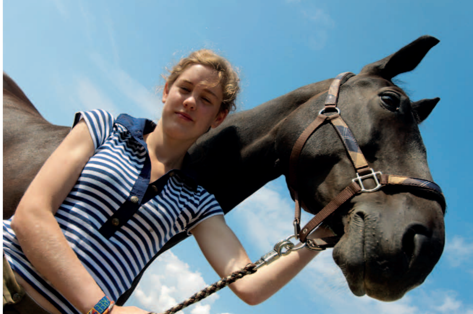
Pegaz wraz z wolontariuszką Klubu Gaja

Imię Pegaza pochodzi od mitologicznego skrzydatego rumaka, który pokonując przeszkody dostał się na Olimp, aby służyć Zeusowi. Spod jego kopyta wytrysnęło źródło, skąd płynęło twórcze natchnienie. To natchnienie towarzyszy wszystkim ratującym konie skazane na rzeź. Uratowany Pegaz stał się inspiracją do podejmowania różnych form działań mających na celu ratowanie koni.