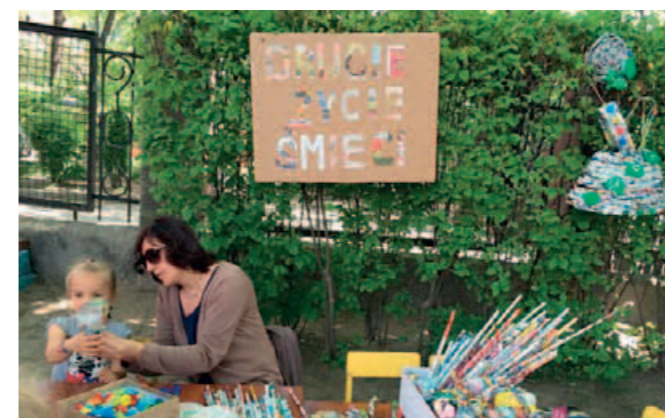
Zespół Szkół Ponadgimnazjalnych nr 2 im. T. Kościuszki w Zamościu