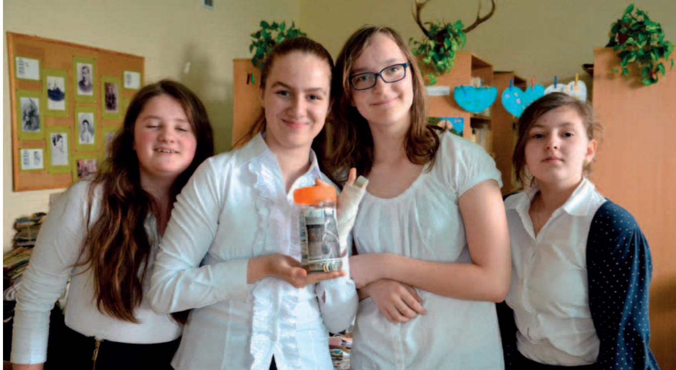
Szkoła Podstawowa nr 6 w Kaliszu

Specjalny Ośrodek Szkolno-Wychowawczy w Oleśnicy po raz kolejny zorganizował zbiórkę makulatury. Konie wiele znaczą dla dzieci z ośrodka, ponieważ pomagają wychowankom z mózgowym porażeniem dziecięcym oraz z autyzmem, zaburzeniami zachowania i niepełnosprawnością ruchową. Konie uratowane od śmierci w rzeźni pełnią w placówce rolę terapeutów. W zbiórkę zaangażowała się spora grupa dzieci, które regularnie odwiedzały sklepy spożywcze, oczyszczając je z niepotrzebnej makulatury.