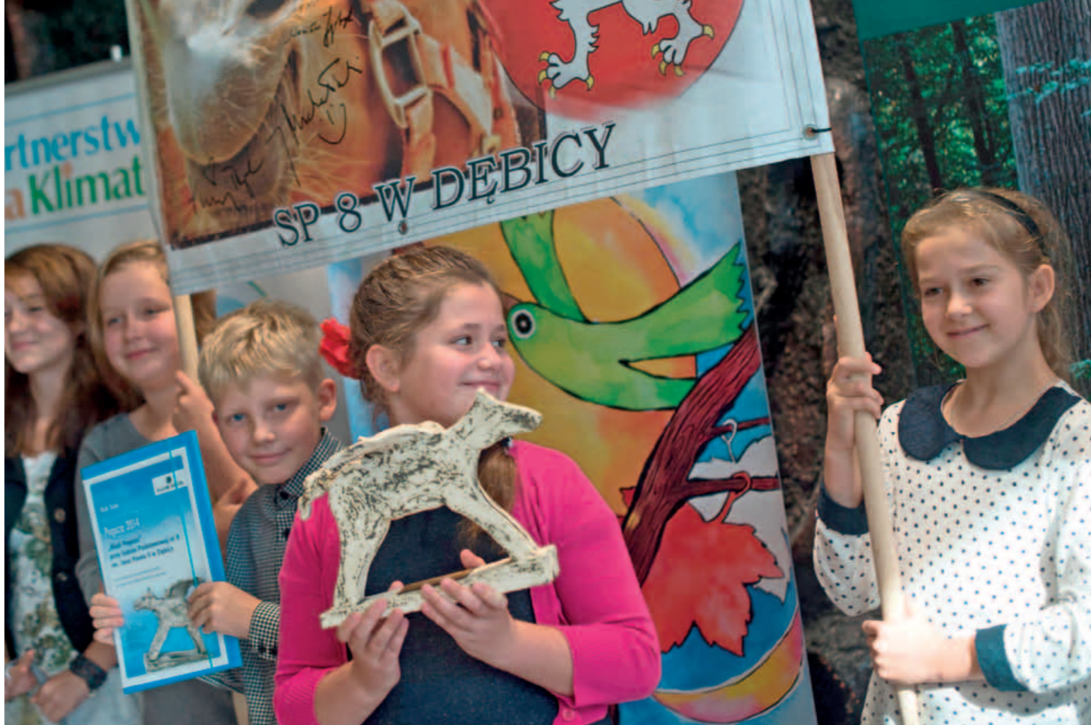
Inauguracja Święta Drzewa 2014 w Warszawie