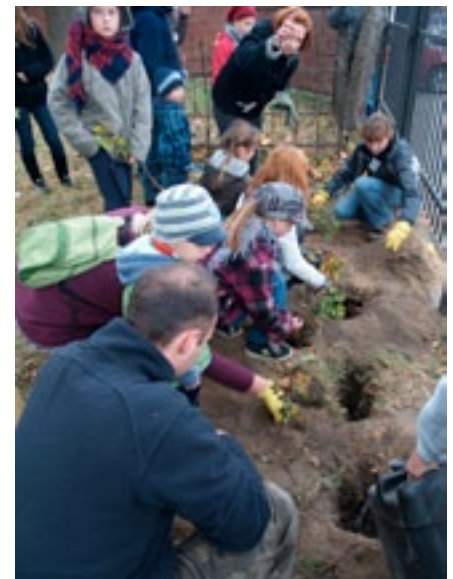
CEE NATURA w Ostródzie

Klub Gaja sadi i chroni drzewa poprzez ogromną rzeszę ludzi, którzy chcą z nim współpracować i pozyskiwać dla tej idei kolejnych partnerów. Namawiamy, aby szukać współpracowników w najbliższym otoczeniu, prezentować ideę Święta Drzewa, podpowiedzieć jak zorganizować je u siebie, pokazać wyniki swoich działań. Zachęcamy, aby wychodzić do innych środowisk takich, jak samorząd lokalny, przedsiębiorcy, spółdzielnie mieszkaniowe, ośrodki kultury, rzemieślnicy i wiele innych. Przecież każdego, na przykład uciechy, Drzewko dobrych manier , takie, jakie zasadzono w Jastrzębiu-Zdroju.