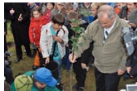
Inauguracja Święta Drzewa w Katowicach – przed Biblioteką Śląską