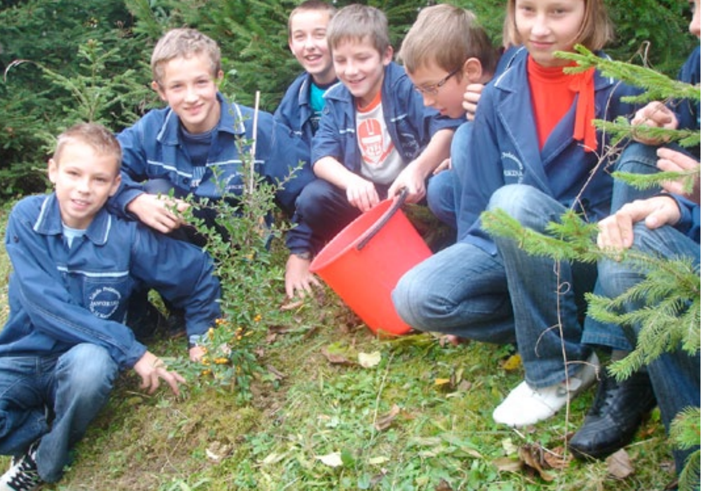
Szkola Podstawowa w Jaworzynie