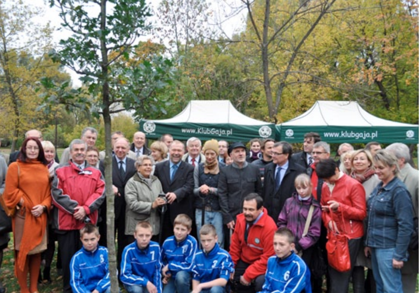
Inauguracja Święta Drzewa w Warszawie – Pole Mokotowskie