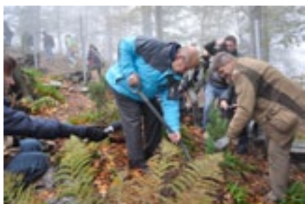
Inauguracja Święta Drzewa na szczycie Szyndzielni w Beskidach