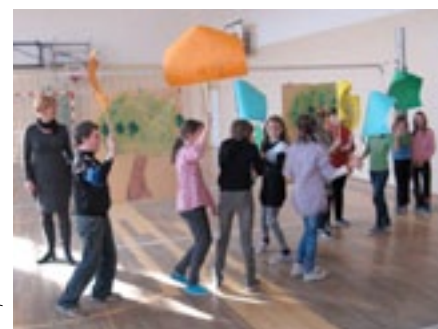
Zespół Szkół w Osielcu

lasów i konieczności sadzenia drzew. Na zakończenie posadzono 20 sosen i brzoź w wyznaczonym terenie.