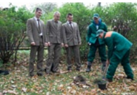
Zespół Szkół Leśnych w Tucholi