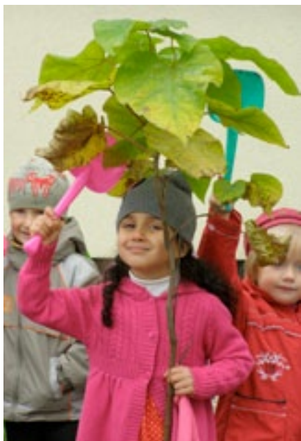
Przedszkole nr 48 w Zabrzcu

Klub Gaja to polska, nowoczesna organizacja ekologiczna, która buduje Pokolenie Eko21 wieku