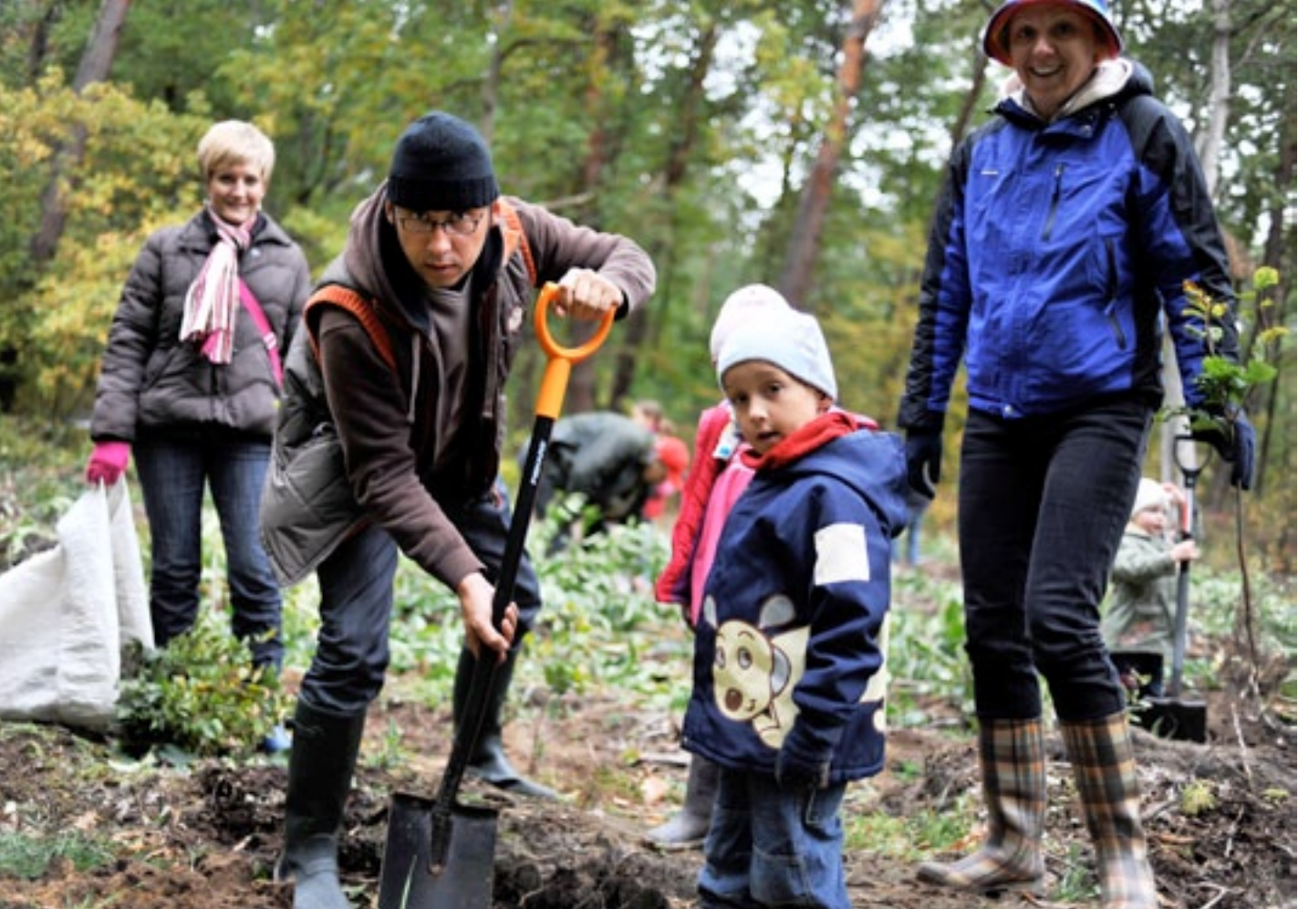
Piknik rodzinny firmy LeasePlan Fleet Management Polska