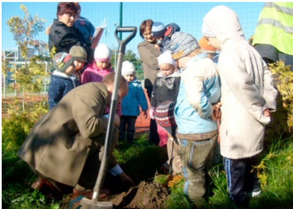
Przedszkole w Głisźnie