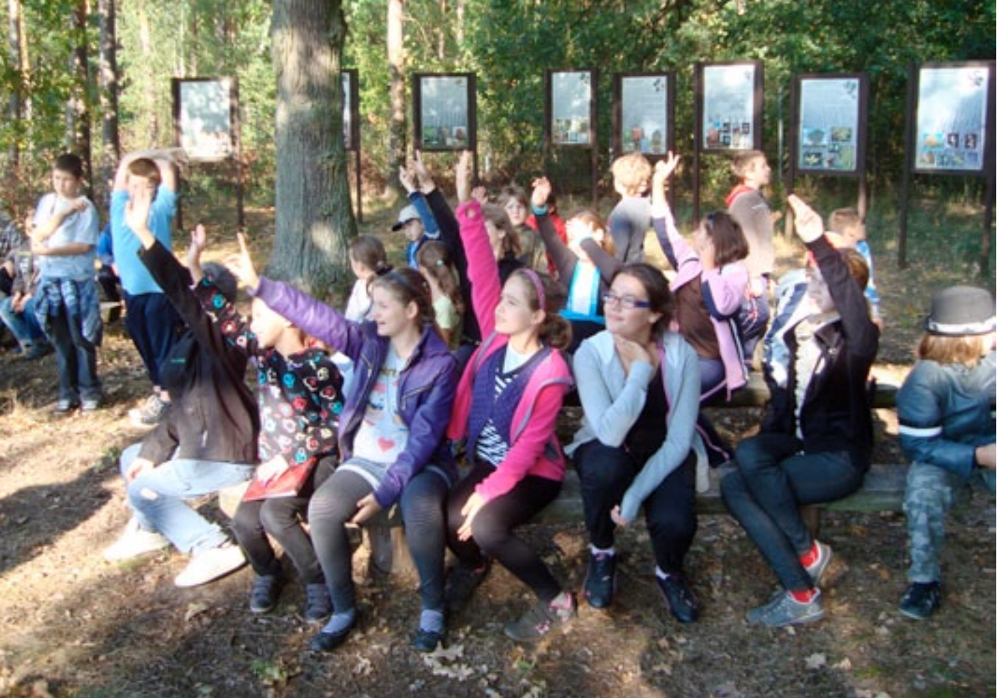
Szkola Podstawowa nr 2 w Toruniu