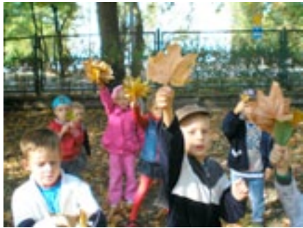
Przedszkole nr 26 w Piotrkowie Trybunalskim