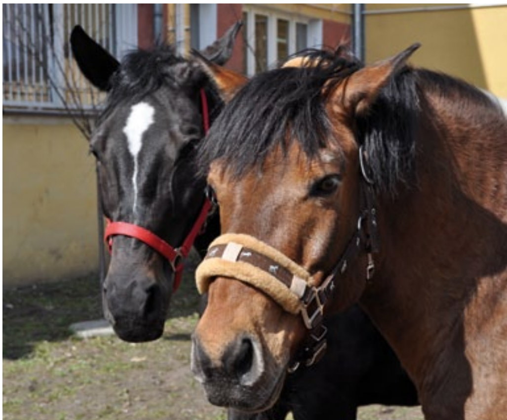
Drumla i Atlantyk

Drygały w zamian za zużyty papier rozdawano sadzonki drzew i krzewów ozdobnych. Wszystkie miały przewiązane niebieskie wstążeczki.