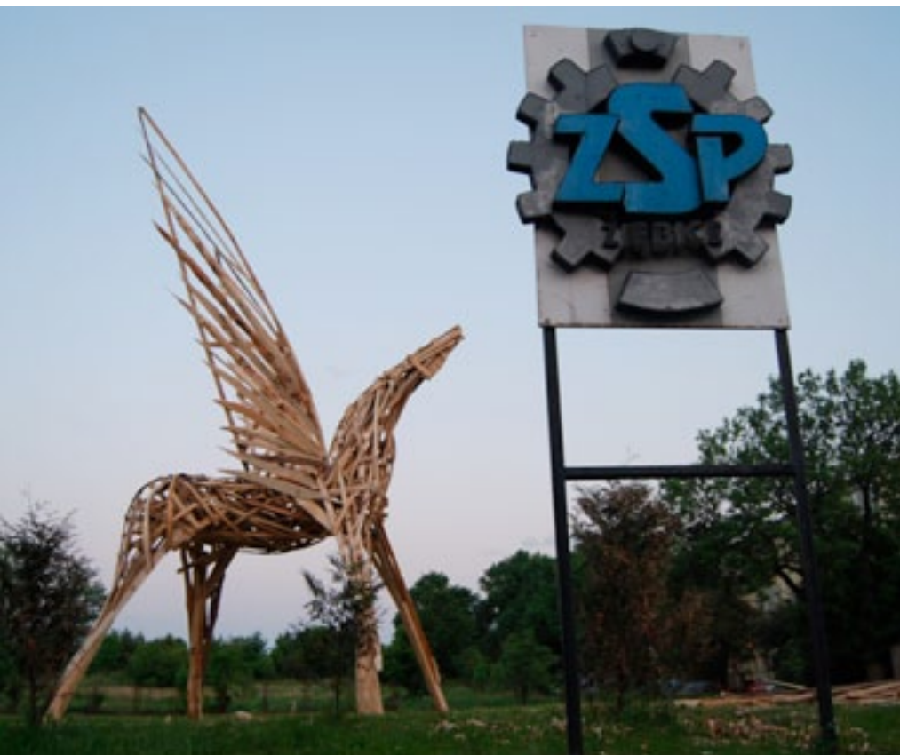
Zespołu Szkół Ponadgimnazjalnych w Ziębicach

Pegaz – nagroda w konkursie Zbieraj makulaturę ratuj konie – stanął przed Zespołem Szkół Ponadgimnazjalnych w Ziębicach