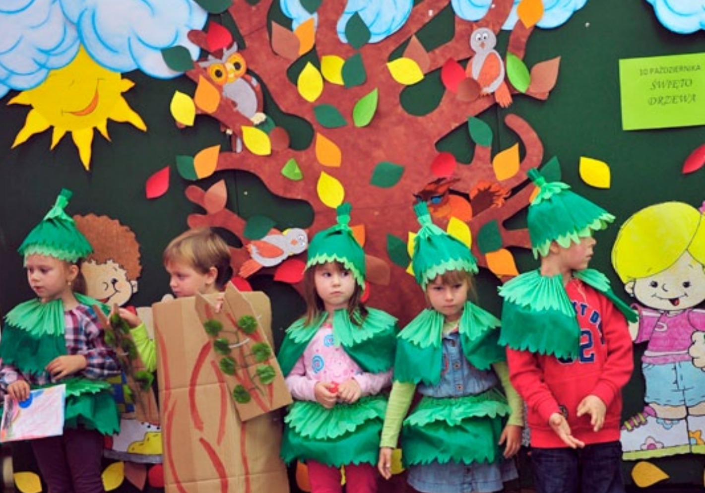
Przedszkole Samorządowe nr 22 w Kielcach