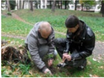
Zespół Szkół nr 2 w Czeladzi