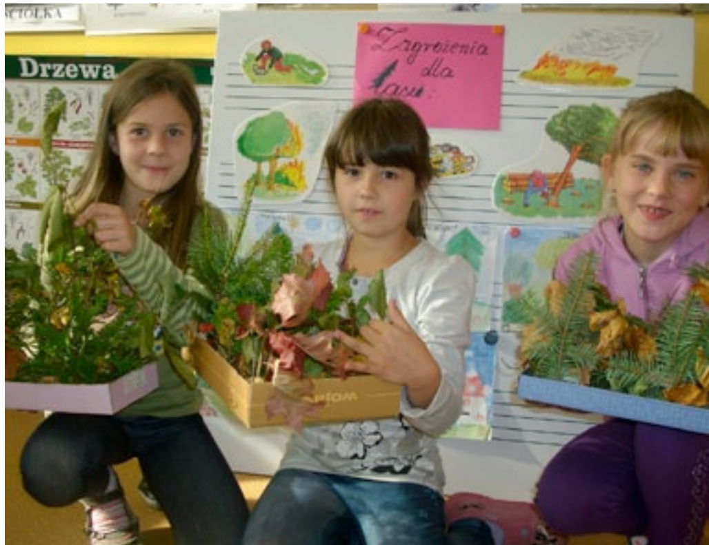
Szkola Podstawowa w Koszarzyskach

konkursowa postanowiła wyróżnić wszystkie klasy jednako- wo. Na holu powstało Drzewo sukcesów , na którym każda klasa chwaliła się swoimi sukcesami. Osiągnięcia te wydru- kowała na liściu w kolorach jesieni. Drzewo jest dekoracją do dziś.