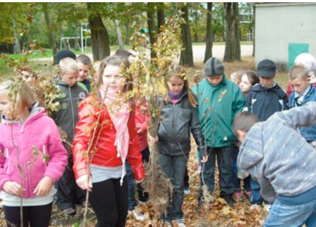
Szkoła Podstawowa w Wyszytach Kościelnych