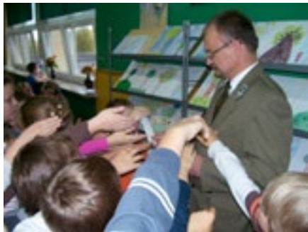
Szkola Podstawowa nr 32 w Kielcach