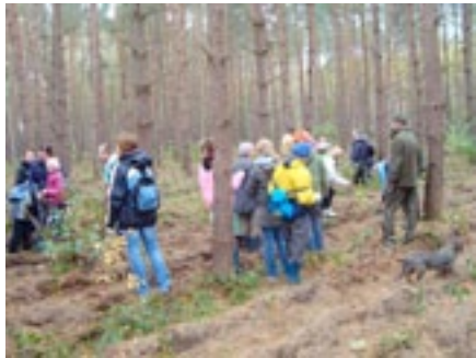
ZSS im. J. Tuwima w Stargardzie Szkoła Podstawowa w Ligocie Polskiej