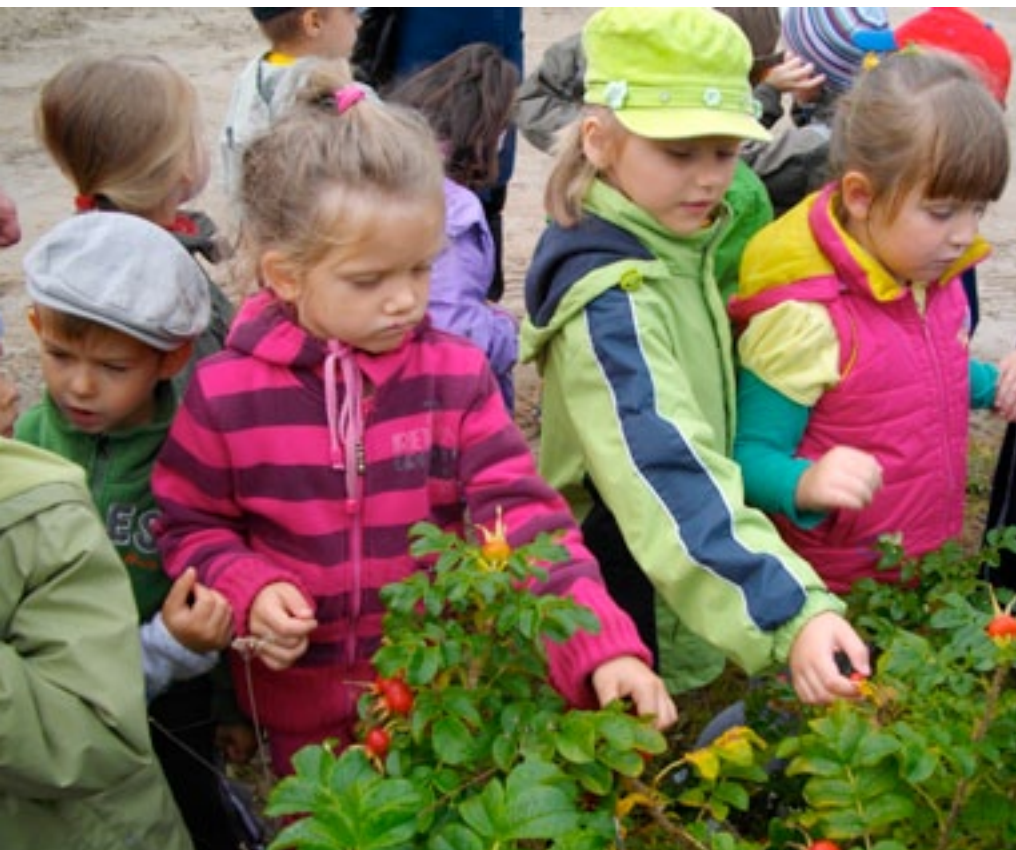
Przedszkole nr 1 w Miastku