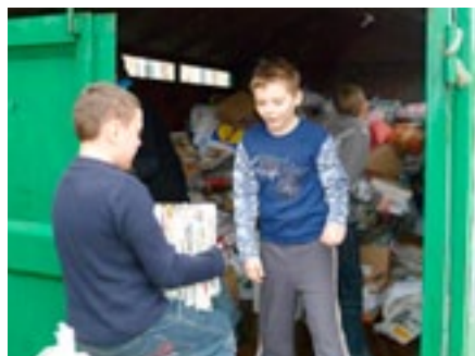
Szkoła Podstawowa nr 21 w Sosnowcu

Uratowane przez Klub Gaja konie: Drumla – z akcji Zbieraj makulaturę, ratuj konie i Atlantyk – z nowej akcji Zbieraj kartridże, ratuj konie służą do hipoterapii dzieci w Zespole Szkół Specjalnych nr 4 w Sosnowcu