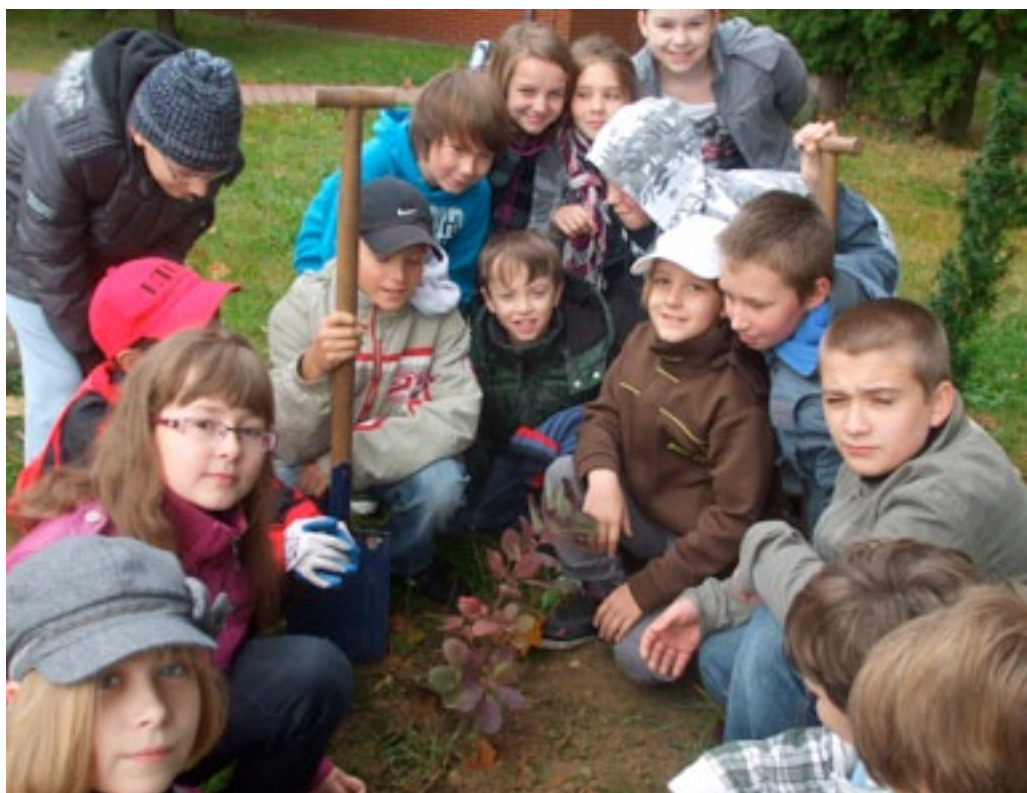
Szkola Podstawowa nr 2 w Warszawie

Zespół Szkół Ponadgimnazjalnych w Nietążkowie zaangażował do współpracy m.in. Nadleśnictwo Kościan . To umożliwiło założenie remizy śródpolnych. Z myślą o najmniejszych ptakach, żyjących w pobliżu rozlewisk, dosadzono jarzębinę. Współpraca pozwoliła także na przybliżenie m.in. wprowadzania młodych drzewek w starodrzewia. Uczniowie Technikum Architektury Krajobrazu zaprojektowali i wykonali wokół szkoły ogród japoński.