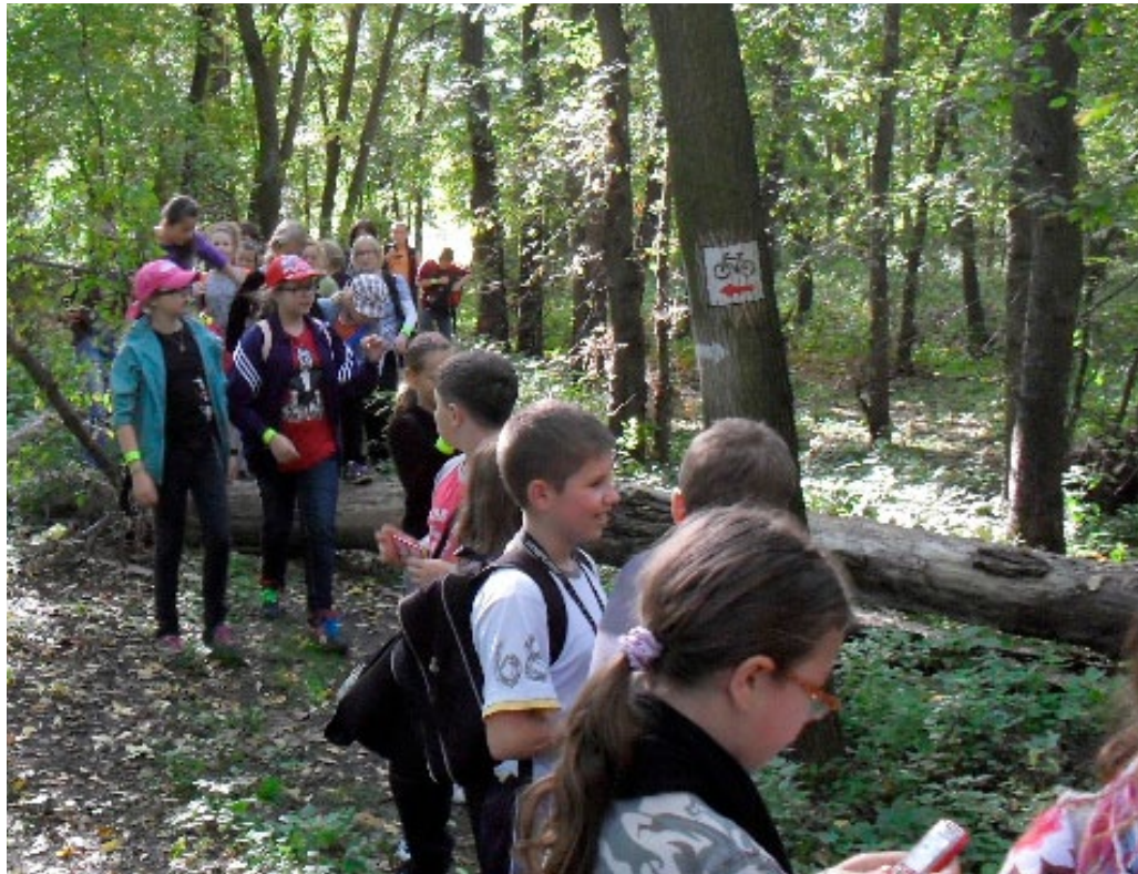
Publiczna Szkoła Podstawowa nr 1 w Nowej Soli

Szkoła Podstawowa im. majora Henryka Sucharskiego w Drawsku Pomorskim nawiązała współpracę z Nadleśnictwem Drawsko Pomorskie i klasy brały udział w zielonych lekcjach przygotowanych przez leśników w lesie. Udało się zaobserwować wielu, bardzo drobnych mieszkańców lasu, jak owady, wiję, pareczniki, ptaki, pająki i mrówki. Wśród szkolnej zieleni pojawiło się nowe, jeszcze małe drzewko – klon pensylwański, które zostało posadzone, jako Drzewo dla Pokoju. Na apelu szkolnym przedstawiono ideę sadzenia Drzew dla Pokoju i sylwetkę Wangari Maathai. W Polsce klony pensylwańskie są rzadko spotykane poza kolekcjami ogrodów botanicznych i arboretów.