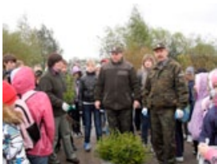
Szkola Podstawowa nr 1 z Oddziałami Integracyjnymi w Goldapi