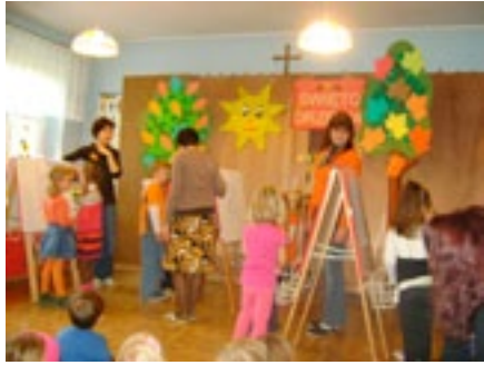
Przedszkole w Toszku