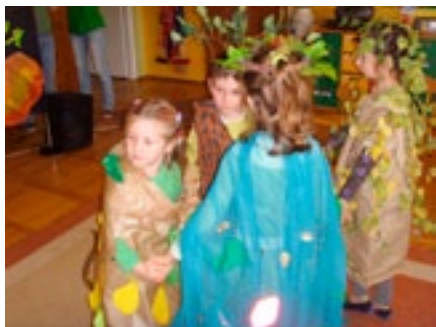
Przedszkole Integracyjne w Koszalinie Publiczne Przedszkole nr 1 Pod Topolą w Kozienicach