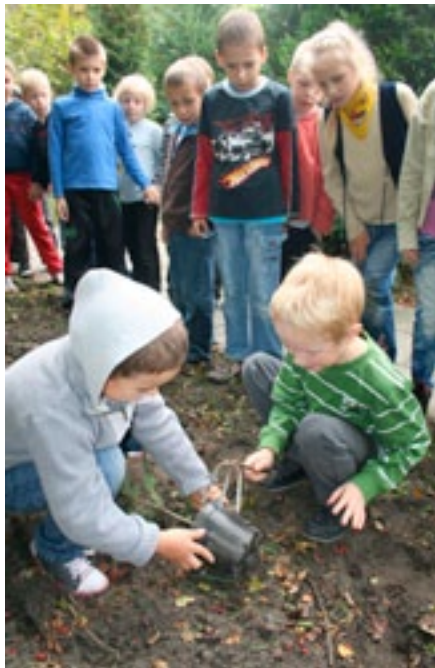
Zespół Szkół w Pyskowicach Szkoła Podstawowa nr 5 i Gimnazjum nr 2