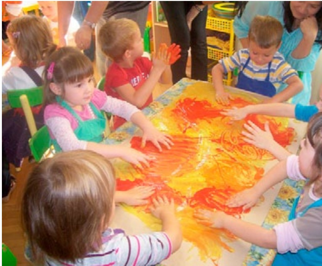
Przedszkole Publiczne w Bystrej

wym placu zabaw – klonu i sosny oraz przed Ośrodkiem Zdrowia w Niewiadowie – czeremchy amerykańskiej.