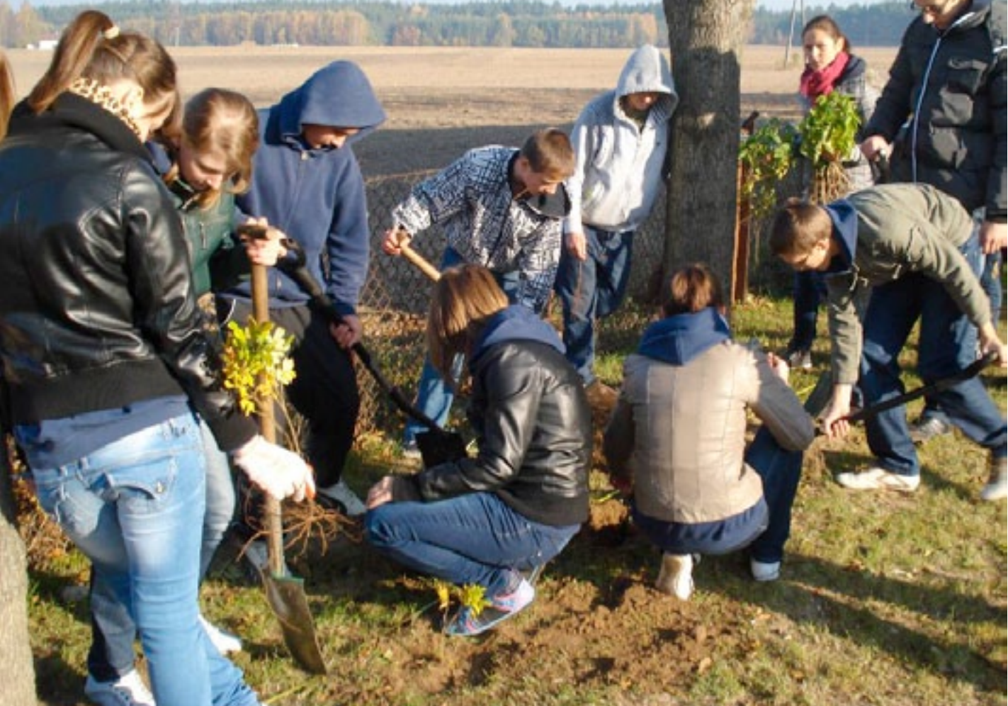
Gimnazjum w Rozogach