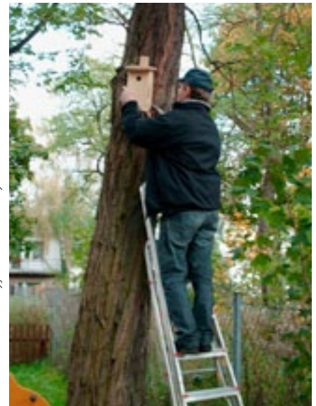
Przedszkole Leśni Przyjaciele w Puszczykowie

Sadzenie drzew, poszukiwanie drzew – pomników przyrody, opowiadanie o drzewach, które są na wyciągnięcie ręki, pozwalają zapamiętać wiadomości o nich, wykorzystując wszystkie zmysły. Klub Gaja zachęca do takich zajęć lekcyjnych, które ukazują drzewa w ich naturalnym otoczeniu. O wiele łatwiej wówczas pojąć, że kiedy umiera las, umiera także człowiek, tak jak zrozumiąły to dzieci z Zelowa.