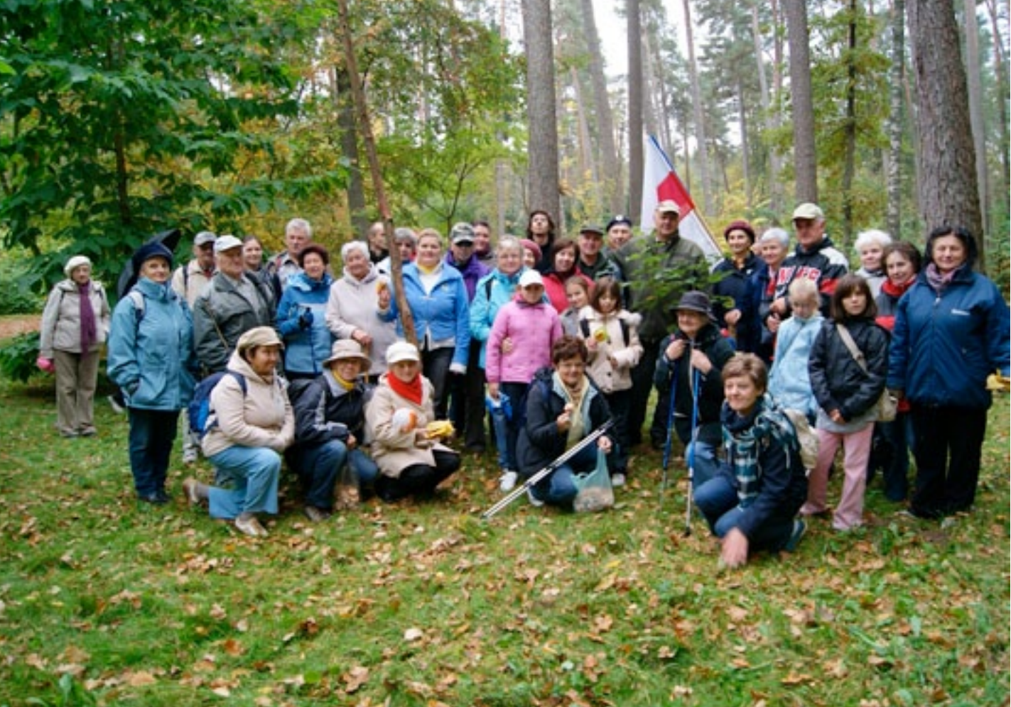
Towarzystwo Przyjaciół Lasu w Kudypach