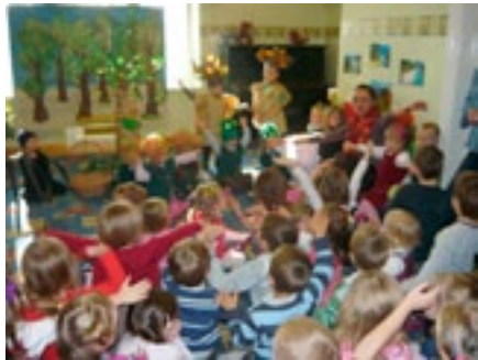
Miejskie Przedszkole nr 2 w Sosnowcu