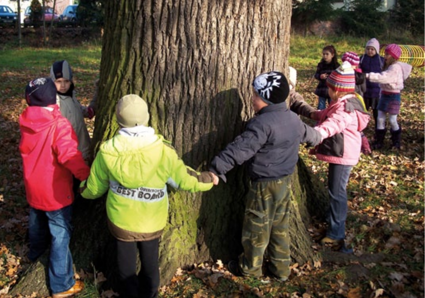
Publiczne Przedszkole nr 3 w Świebodzinie