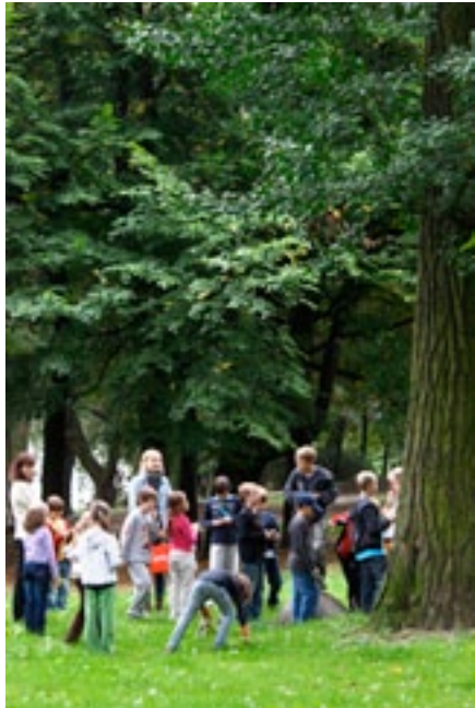
Publiczna Szkoła Podstawowa nr 5 w Brzegu