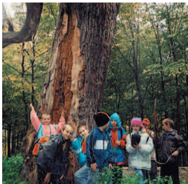
Uczniowie Zespołu Szkół w Niemczy

Program został także poszerzony o ustanawianie drzew – pomników przyrody, odnajdywanie drzew – świadków historii i zakładanie przyszkolnych ogrodów.