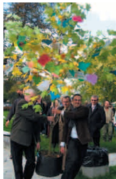
Drzewo Życzeń w Warszawie

Podczas 5. Święta Drzewa posadzono ponad 36 200 drzew. W programie wzięło udział ponad 57 300 osób.