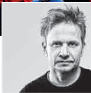
BARTŁOMIEJ TOPA, aktor, ambasador Klubu Gaja