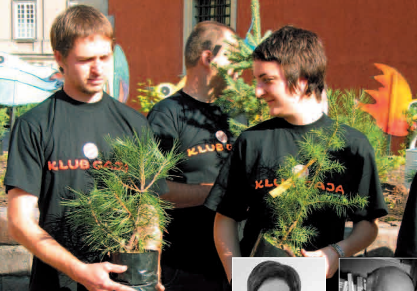
Inauguracja 3. Święta Drzewa na Placu Zamkowym w Warszawie