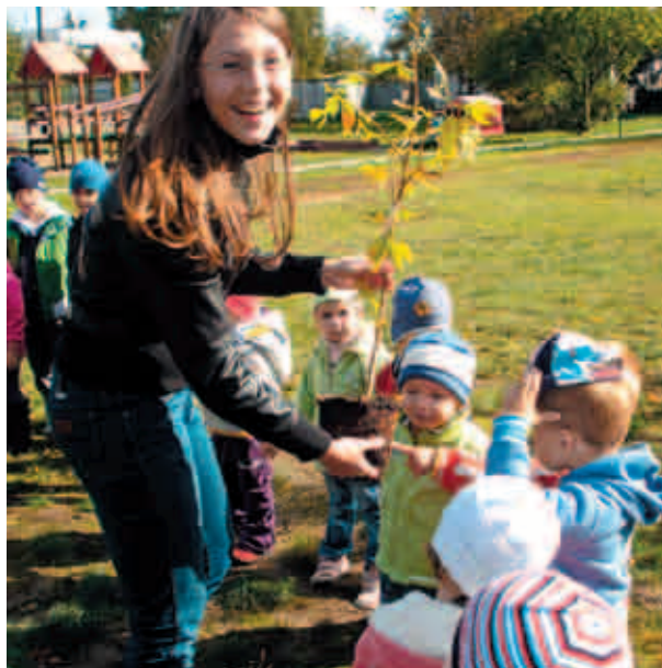
Przedszkole Koniczynka w Mosinie

Drzewa zasadzili wspólnie m.in. Minister Ochrony Środowiska – Maciej Nowicki i Prezes Fundacji Wielkiej Orkiestry Świątecznej Pomocy – Jurek Owsiak. Wydarzenie poprzedziła konferencja prasowa w siedzibie Business Centre Club, w której wzięli