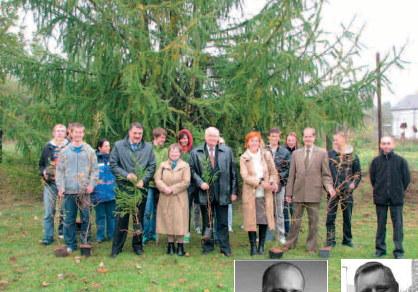
Starostwo Powiatowe w Limanowej

Powiatowe Centrum Ekologiczne Wydziału Ochrony Środowiska, Rolnictwa i Leśnictwa Starostwa Powiatowego w Limanowej organizuje Święto Drzewa wraz