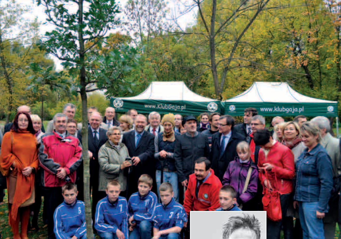
Inauguracja Święta Drzewa w Warszawie – Pole Mokotowskie