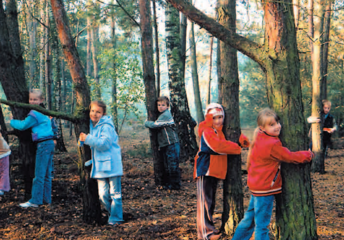
Szkola Podstawowa w Pacynie, koło ekologiczne Ekoludki