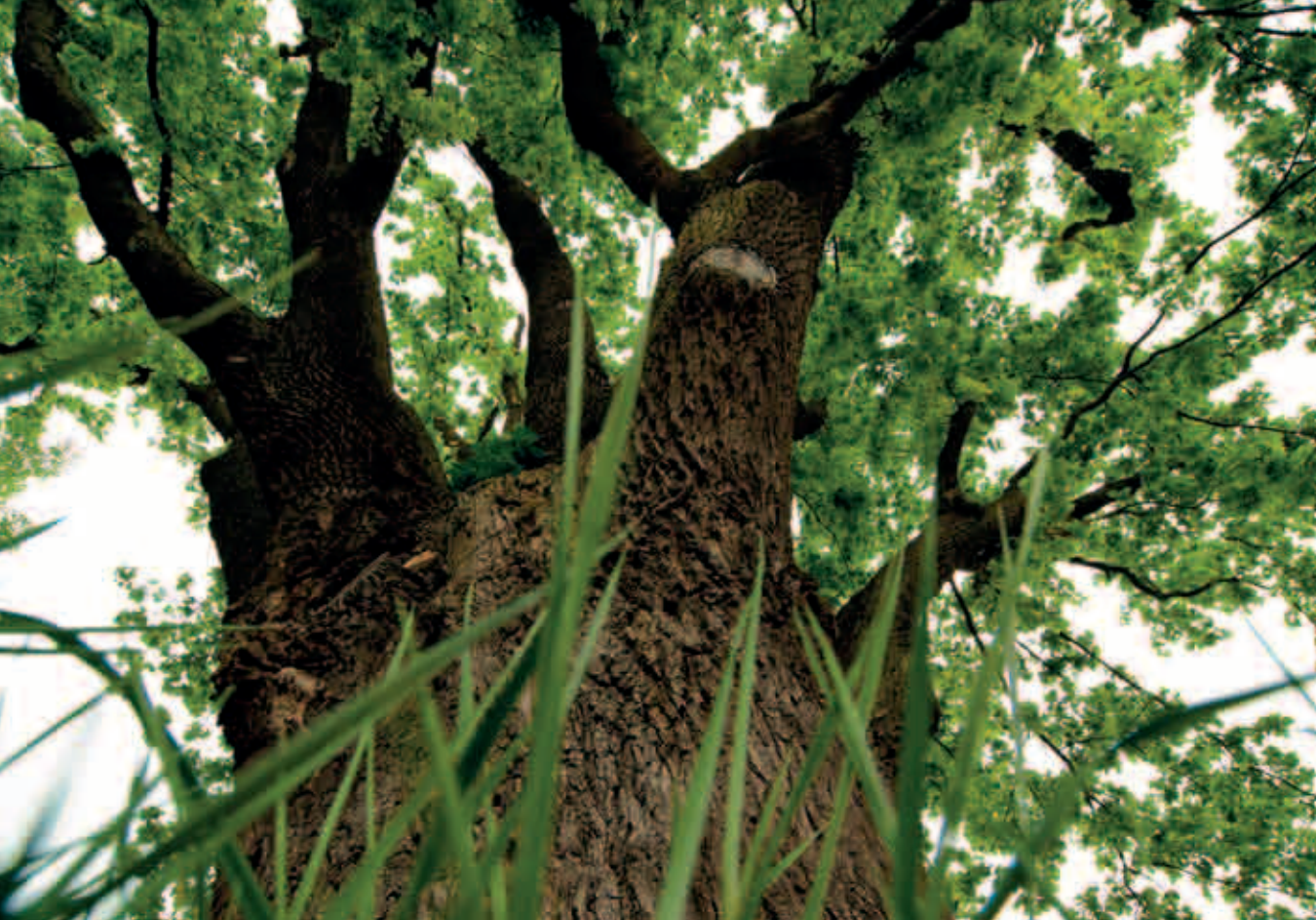
Drzewo Roku 2011 – dąb Grot w Dęblinie