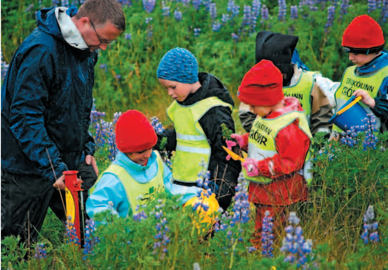
Sadzenie drzew w Grindavíku w Islandii