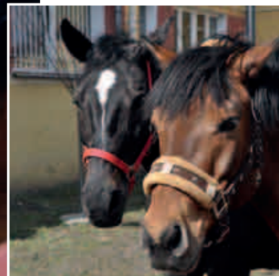
Uratowane przez Klub Gaja konie: Drumla – z akcji Zbieraj makulaturę, ratuj konie i Atlantyk – z nowej akcji Zbieraj kartridże, ratuj konie służą do hipoterapii dzieci w Zespole Szkół Specjalnych nr 4 w Sosnowcu.

Ze wszystkimi pracownikami szkoły zbierali makulaturę uczniowie Szkoły Podstawowej w Toszku. Zużyty papier gromadzili także dziadkowie dzieci, grono pedagogiczne, panie – sekretarki, dyrektorki, kucharki i sprzątaczkę. Przyłączyli się też lokalni przedsiębiorcy – firma Intermet i drukarnia. Część makulatury wykorzystano do zrobienia kartek świątecznych sprzedawanych na festynie.