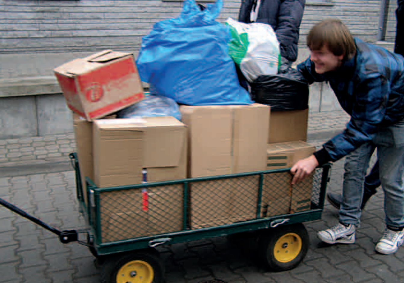
Liceum Ogólnokształcące nr 43 w Warszawie