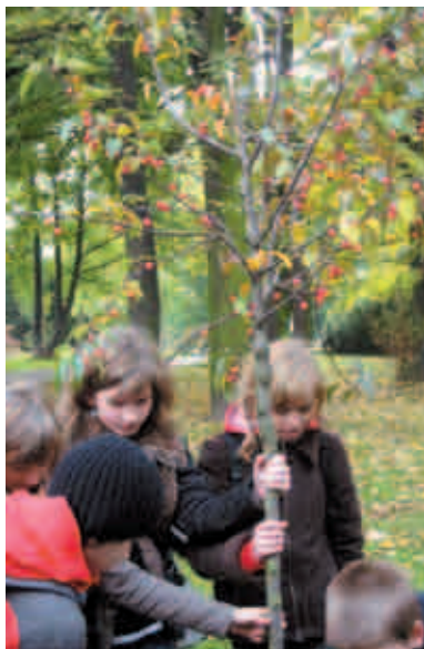
Jabłonie ozdobne w Warszawie