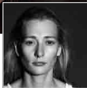
MAGDALENA POPŁAWSKA, aktorka, ambasadorka Klubu Gaja

O sadzeniu drzew słyszałam jako dziecko, dlatego fajnie jest teraz samemu brać w tym udział, zwłaszcza, że robię to pierwszy raz w życiu. Dobrze, że towarzyszy temu tak duże zainteresowanie medialne. Kiedy akcja zostanie rozpropagowana i nagłośniona będzie przynosiła jeszcze większe owoce. Chciałabym dawać przykład innym.