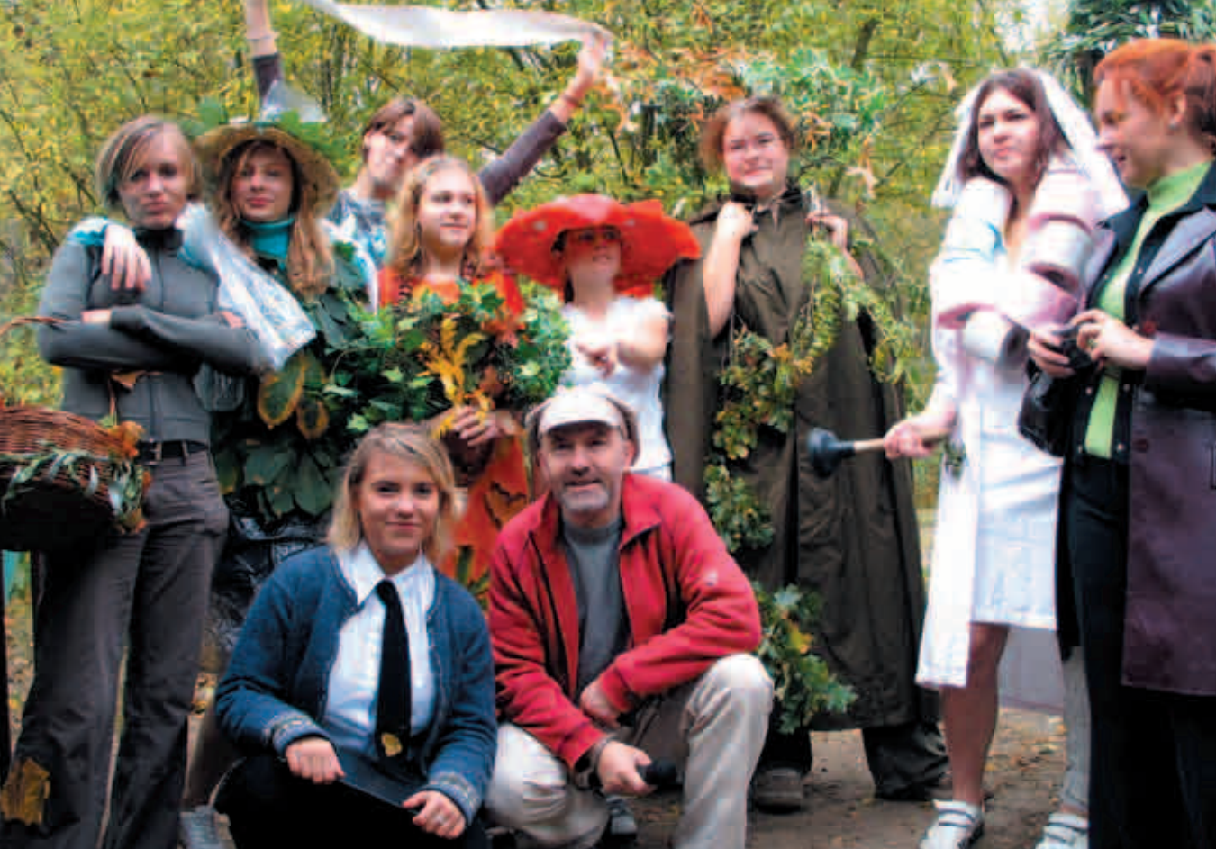
Happening warszawskich szkół: SP nr 314, 340, 344 oraz LO nr 46