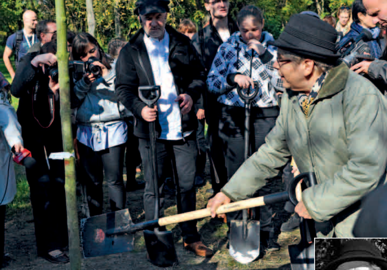
Inauguracja 8. edycji Święta Drzewa w Warszawie