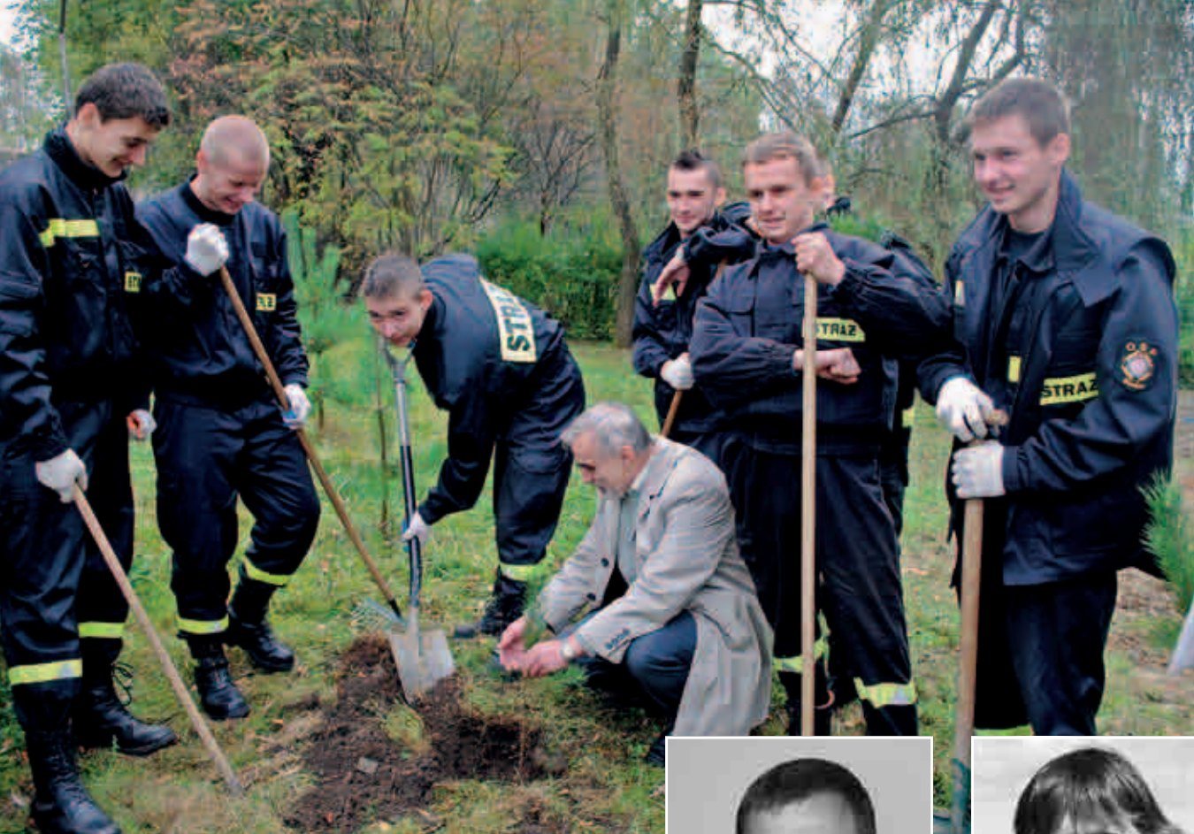
Zespół Szkół im. KEN w Tymbaraku