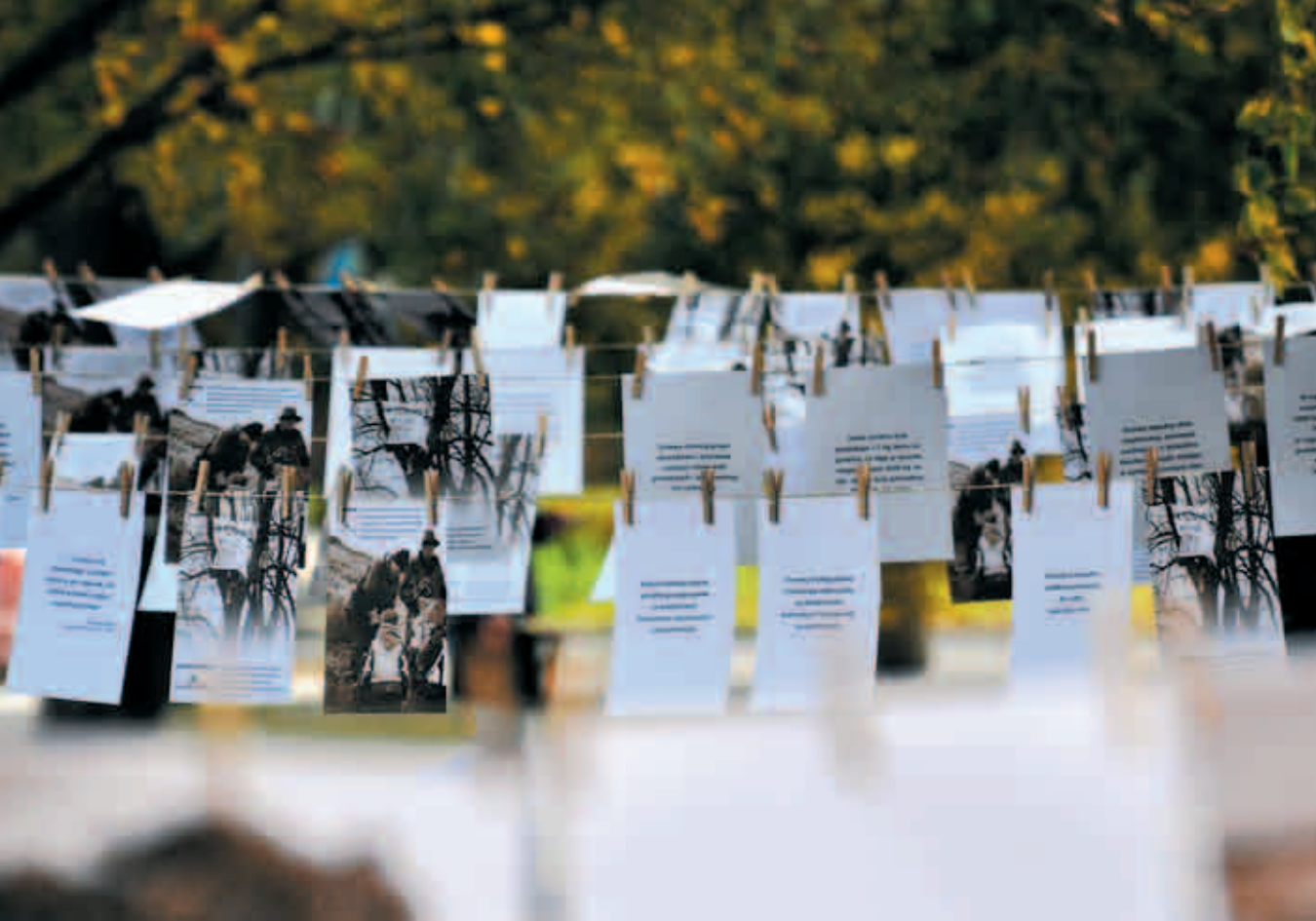
Happening Klubu Gaja Od drzewa do drzewa