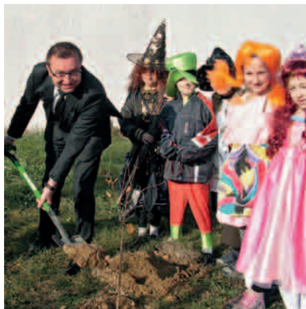
Szkola Podstawowa w Ligocie Polskiej

Szkolna ostoja przyrody Młodzieżowego Ośrodka Wychowawczego w Debrznie, który w 2010 roku Święto Drzewa obchodził od października do końca listopada, z wszystkimi uczniami i całym gronem pedagogicznym. Na korytarzu powstało Drzewo marzeń – marzenia opisywano na własnoręcznie ozdabianych i przywieszanych listkach. Z Nadleśnictwem Człuchów zorganizowano warsztaty fotograficzne. Współpraca z Nadleśnictwem Złotów umożliwiła zasadzenie 250 drzew w szkolnej ostoji przyrody i w parku obok szkoły. Były także prace porządkowe wokół placówki i Stowarzyszenia na Rzecz Rozwoju Miasta i Gminy Debrzno.