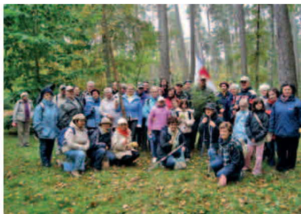
Towarzystwo Przyjaciół Lasu w Kudypach

Drzewa bezdomnych Stowarzyszenia Pomocy Ludzie Ludziom z Wrocławia. Stowarzyszenie do programu zaangażowało osoby borykające się z problemem marginalizacji społecznej i bezdomnością. Dzięki kilkuletniej współpracy ze spółką ogrodniczą