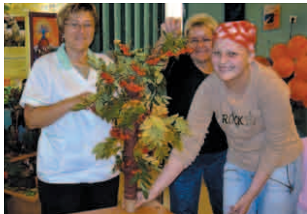
Klinika Pediatrii, Hematologii i Onkologii Szpitala im. dr. A. Jurasza w Bydgoszczy