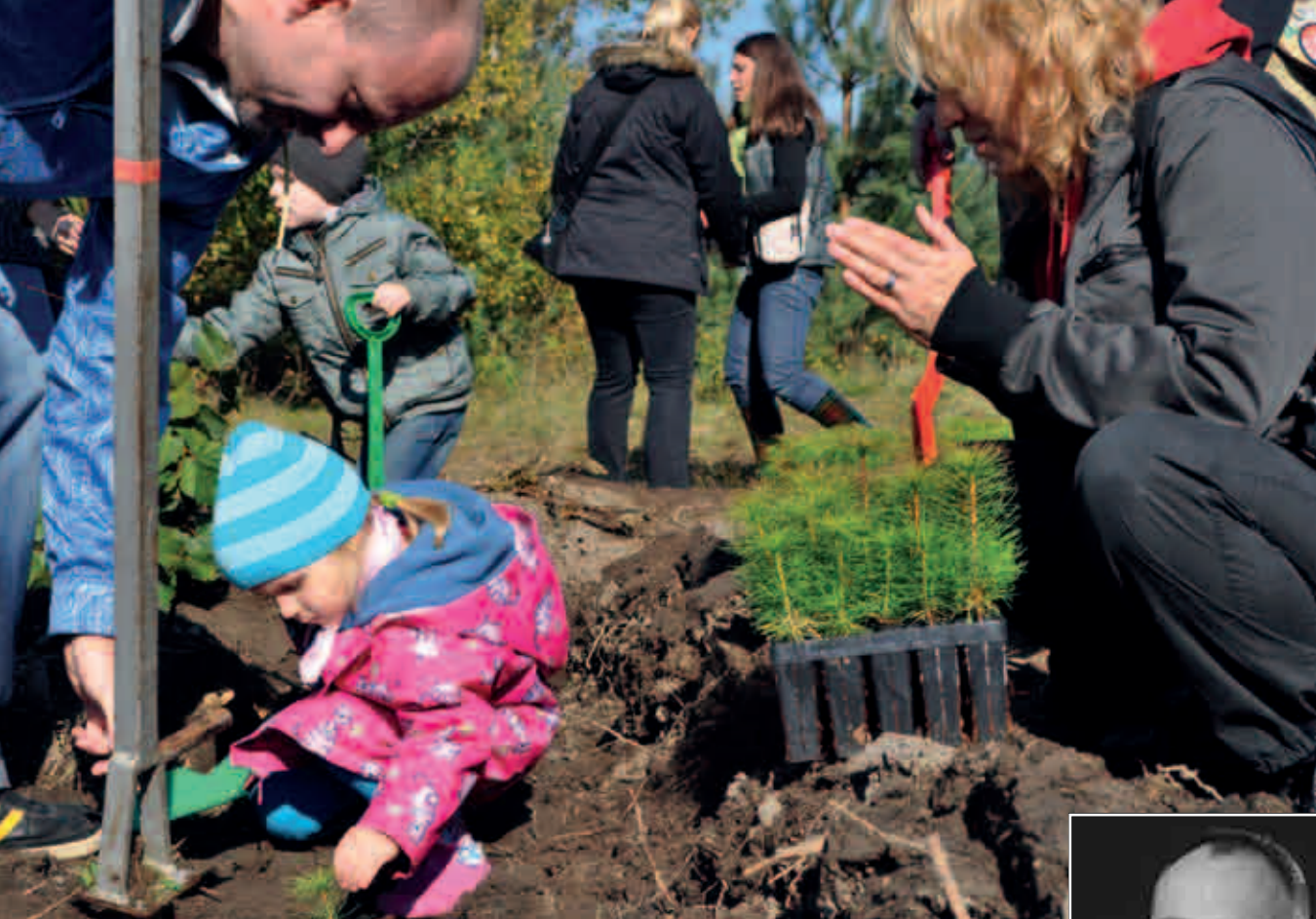
Piknik firmy LeasePlan Fleet Management