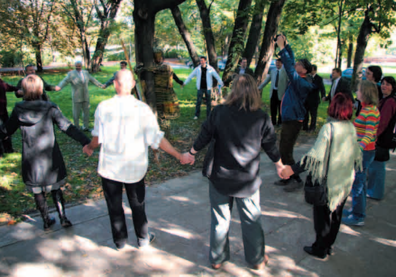
Centrum Sztuki Współczesnej Zamek Ujazdowski w Warszawie