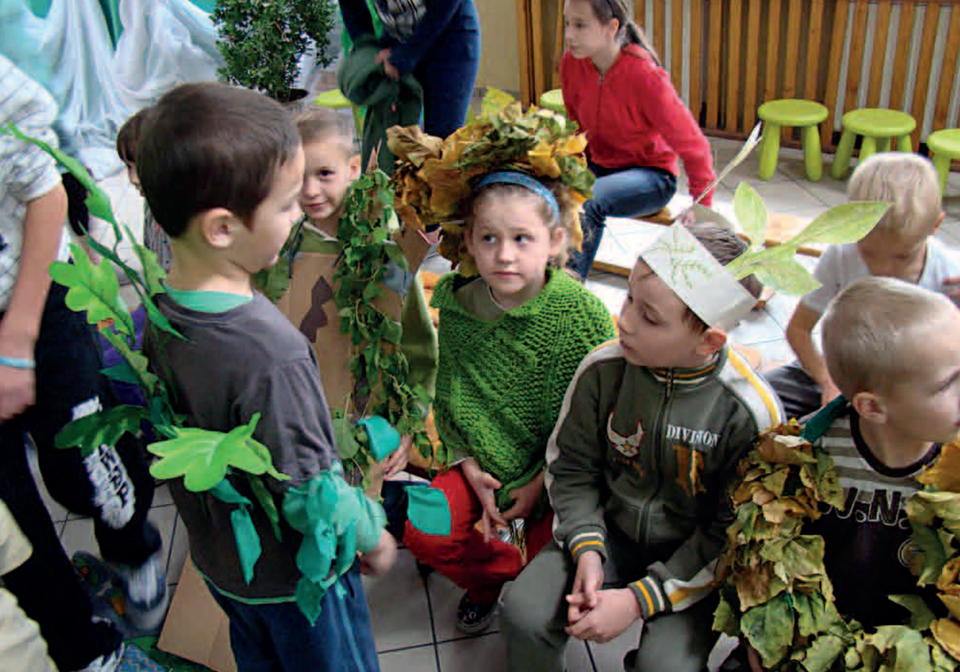
Szkola Podstawowa w Sarbinowie