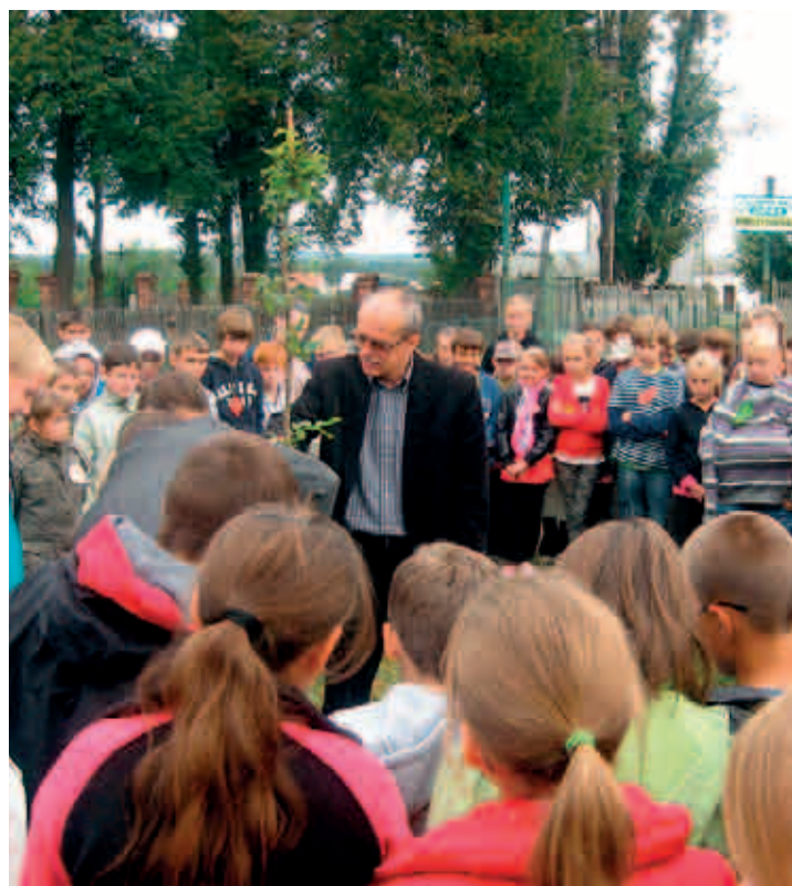
Urząd Gminy Bralin

Urząd Miasta i Gminy Witnica wspólnie z Nadleśnictwem Bogdaniec zaangażowały społeczność lokalną w coroczną akcję sadzenia drzew w liczbie odpowiadającej aktualnej liczbie mieszkańców gminy. W 2008 roku posadzono 2 500 drzew w ramach projektu Jedno drzewko na jednego mieszkańca Gminy Witnica .