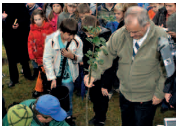
Biblioteka Śląska w Katowicach