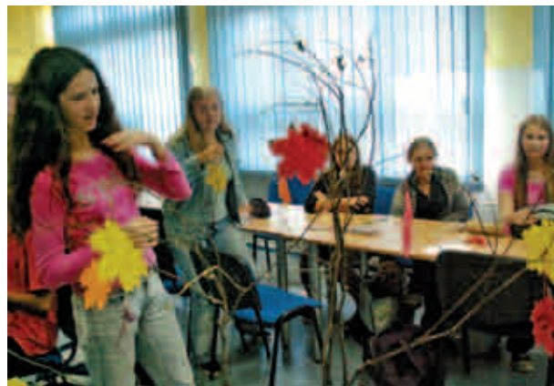
Gimnazjum nr 3 w Mysłowicach z Oddziałami Integracyjnymi