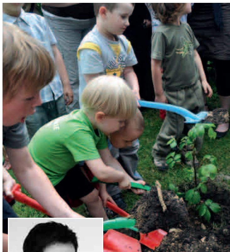
Przedzkołe Nieogócińskie Skrzaty w Warszawie

Gazeta Wyborcza 10.10.2003 r. Uczniowie ponad tysiąca polskich szkół posadzą dziś drzewa.