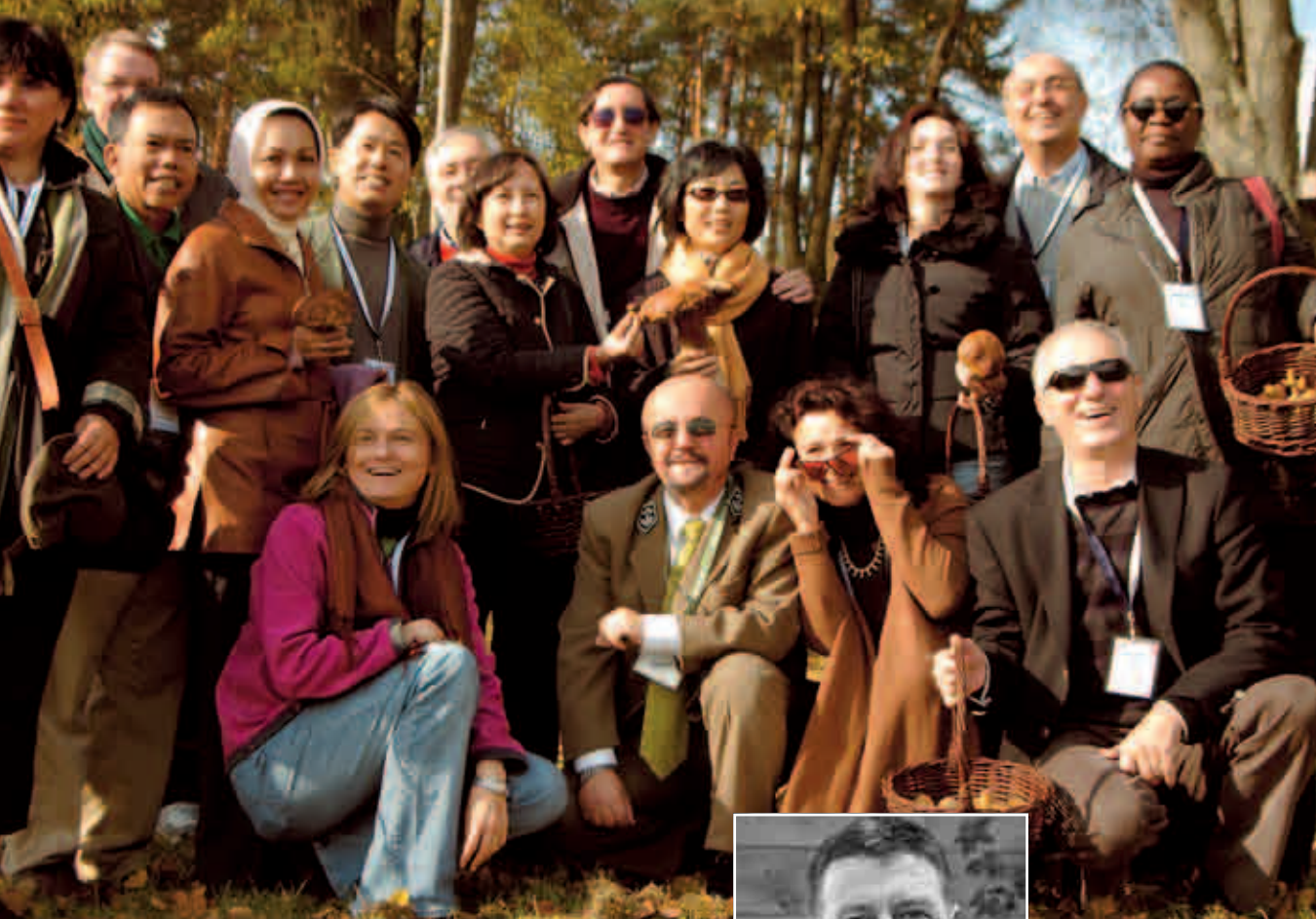
Szefowie misji dyplomatycznych w Nadleśnictwie Krynki