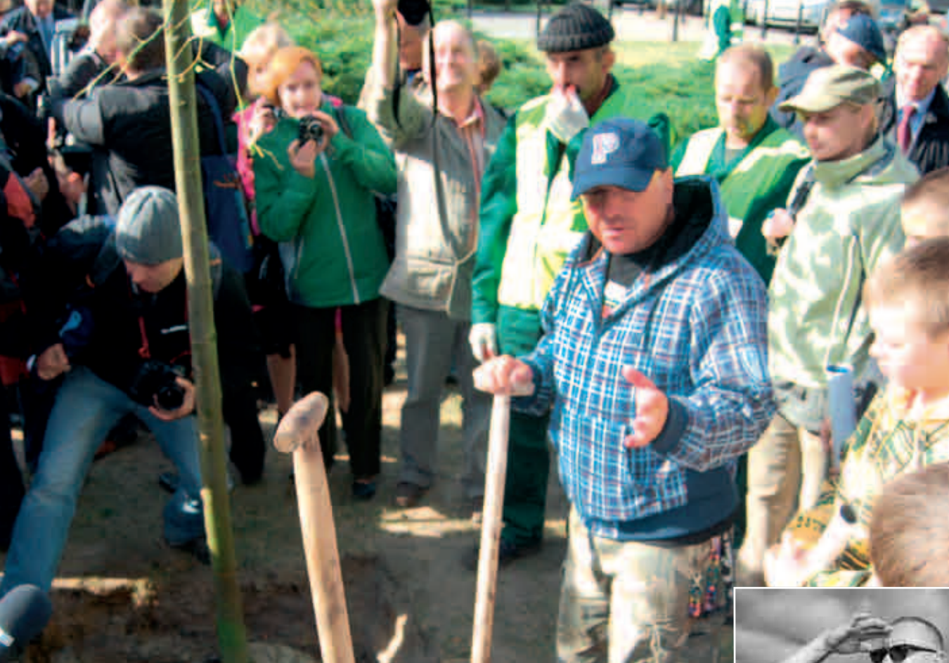
Jurek Owsiak sadzi drzewo podczas 7. Święta Drzewa w Warszawie