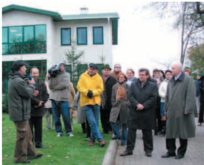
Święto Drzewa w firmie Troton w Ząbrowie

Kurier Radia Bielsko maj 2012 r. Od 18 do 20 maja przed hipermarketem Auchan w Bielsku-Białej po raz kolejny trwała będzie akcja Klubu Gaja Zbieraj makulaturę, ratuj konie. Pieniądze uzyskane ze zbiórki makulatury zostaną przeznaczone na ratowanie koni.