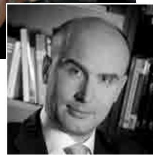
MARCIN KOROLEC Minister Środowiska

Bardzo ważne jest, żeby młodzi ludzie byli uwrażliwiani na piękno przyrody i problemy jej niszczenia – nie tylko w rodzinie, czy w szkole, ale także poprzez wydarzenia w społeczności lokalnej. Właśnie przykładem takiej aktywnej działalności jest Święto Drzewa, które nie tylko wpływa na poziom świadomości ekologicznej, czy upowszechnianie wiedzy o przyrodzie i propagowanie zachowań korzystnych dla środowiska naturalnego – to także nabywanie wiedzy bazującej na przeżyciach. Przyrody uczymy się najlepiej od niej samej.