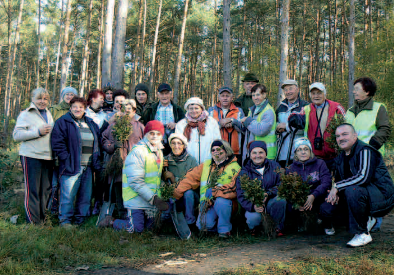
Stowarzyszenie Ekologiczno-Kulturalne Pakla z Międzyrzecza