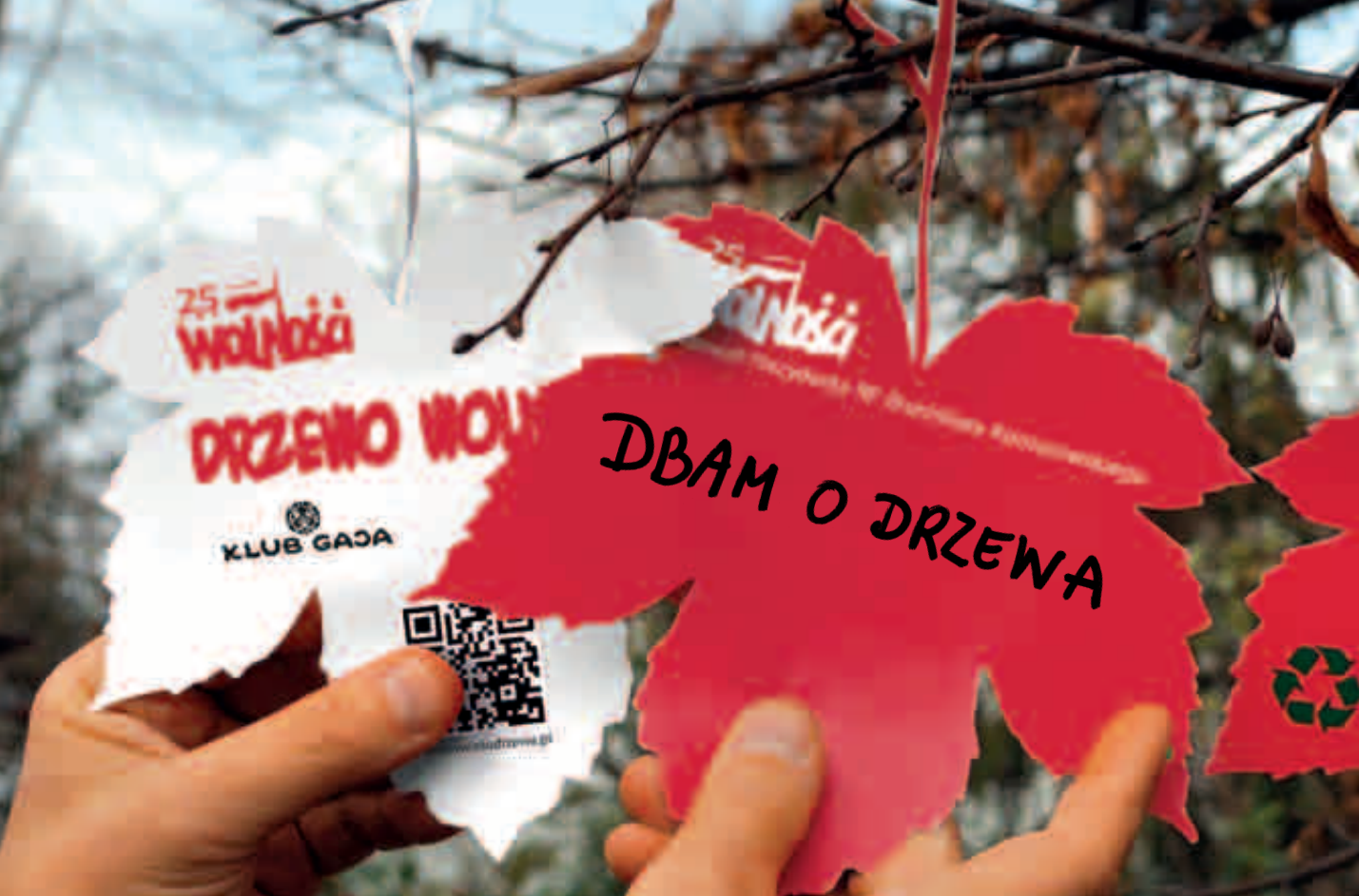
Liście wykorzystane w happeningu Drzewo Wolności z okazji obchodów 25 lat Wolności na Krakowskim Przedmieściu w Warszawie, Święto Drzewa 2014