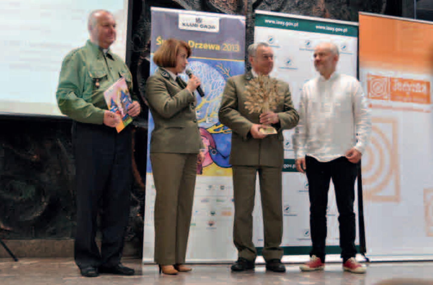
Gala rozdania nagród – statuetek Czarodziejskiego Drzewa, inauguracja Święta Drzewa w Warszawie, 2013