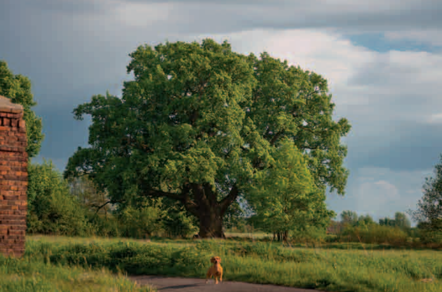
Drzewo Roku 2014 Dąb Słowianin zgłoszony przez grupę rowerzystów Rowerem przez Jelcz