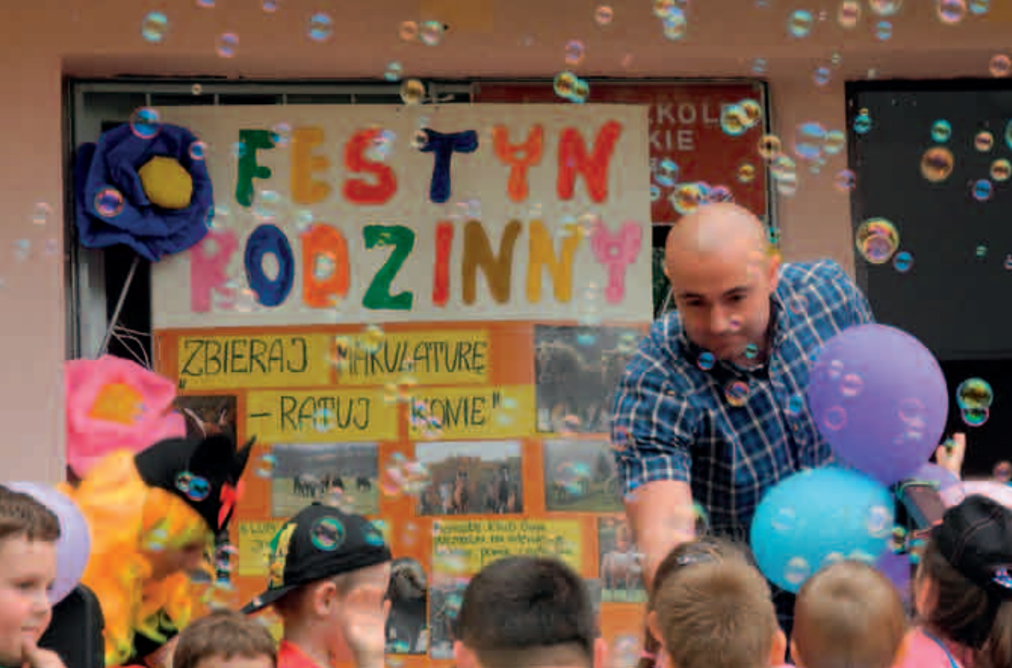
Przedszkole nr 171 w Łodzi

Urząd Miejski czy Starostwo Powiatowe. Uczniowie ponadto przygotowywali całoroczne oraz okazyjne gazetki ścienne na temat zbiórki oraz konkursów, brali udział w licznych konkursach, np. konkursie wiedzy W cieniu dębowego drzewa czy konkursie plastycznym Rola konia w literaturze, historii, sztuce, transporcie, rolnictwie .