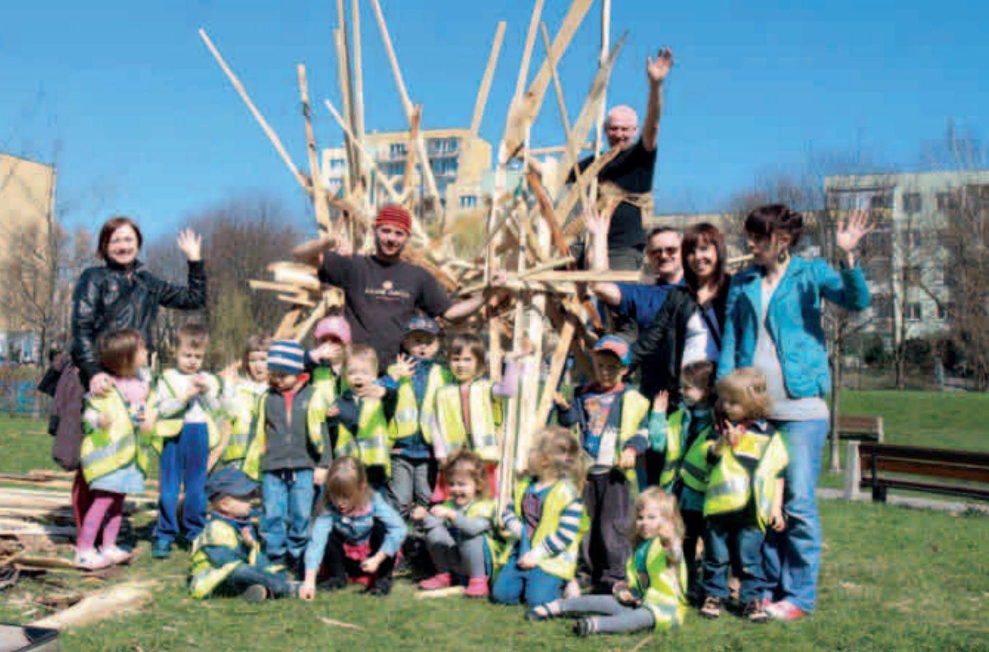
Dzieci z Punktu Przedszkolnego Gapcio budują rzeźbę Pegaza, Warszawa 2013