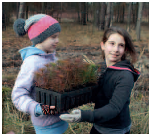
Sadzenie drzew w Lesie Sobieskiego w Warszawie, Święto Drzewa 2013

Święto Drzewa to szeroko zakrojona edukacja – na temat zrównoważonego rozwoju i zmian klimatu, twórcza współpraca i działania praktyczne – sadzenie i ochrona drzew. W ten sposób ludzie w całym kraju podejmują rzeczywiste, obywatelskie działania dla środowiska naturalnego i dla wspólnego dobra. Budują kapitał ekologiczny i społeczny.