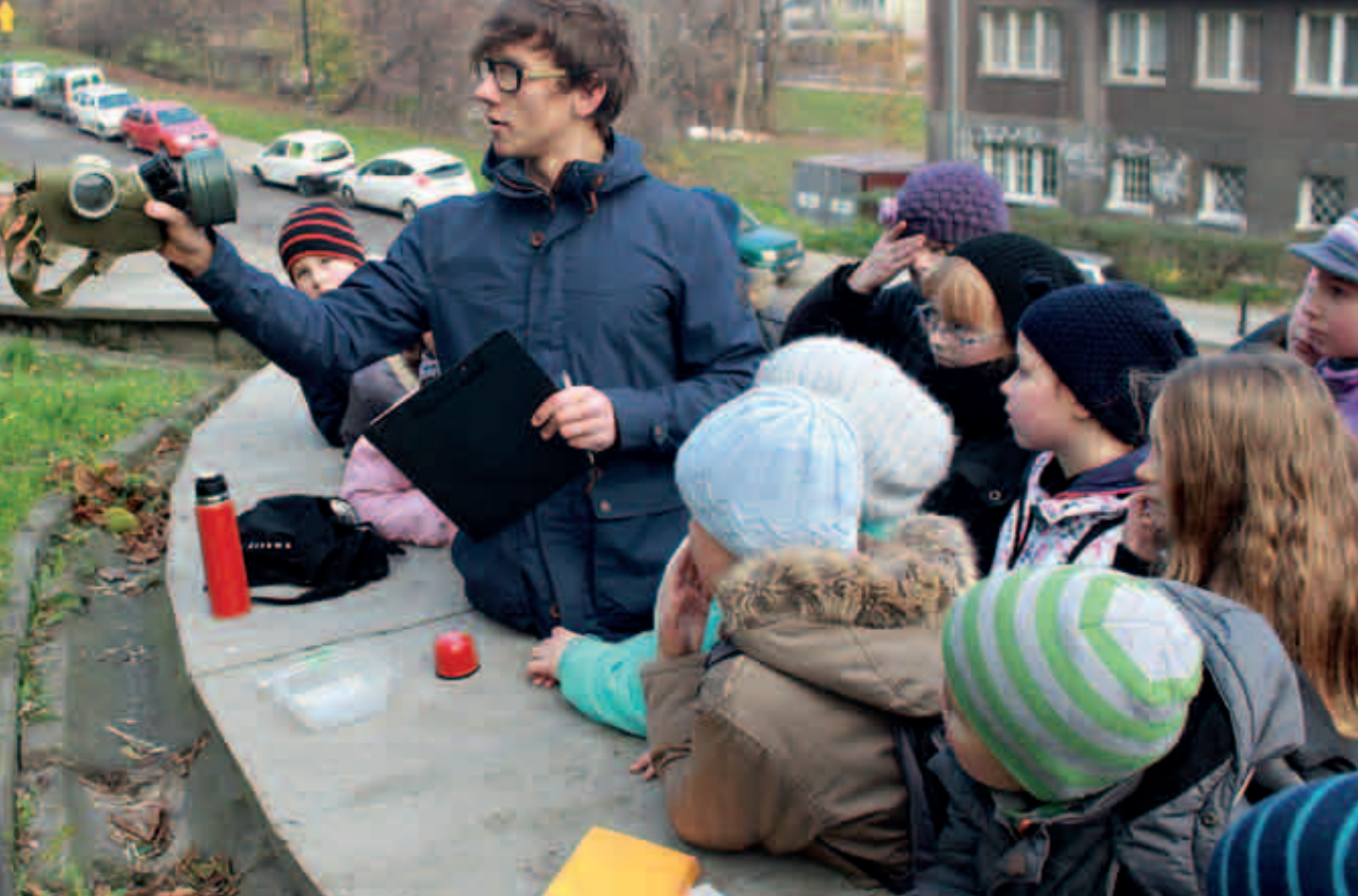
Gra miejska W dobrym klimacie podczas Konferencji Klimatycznej COP19 w Warszawie, 2013