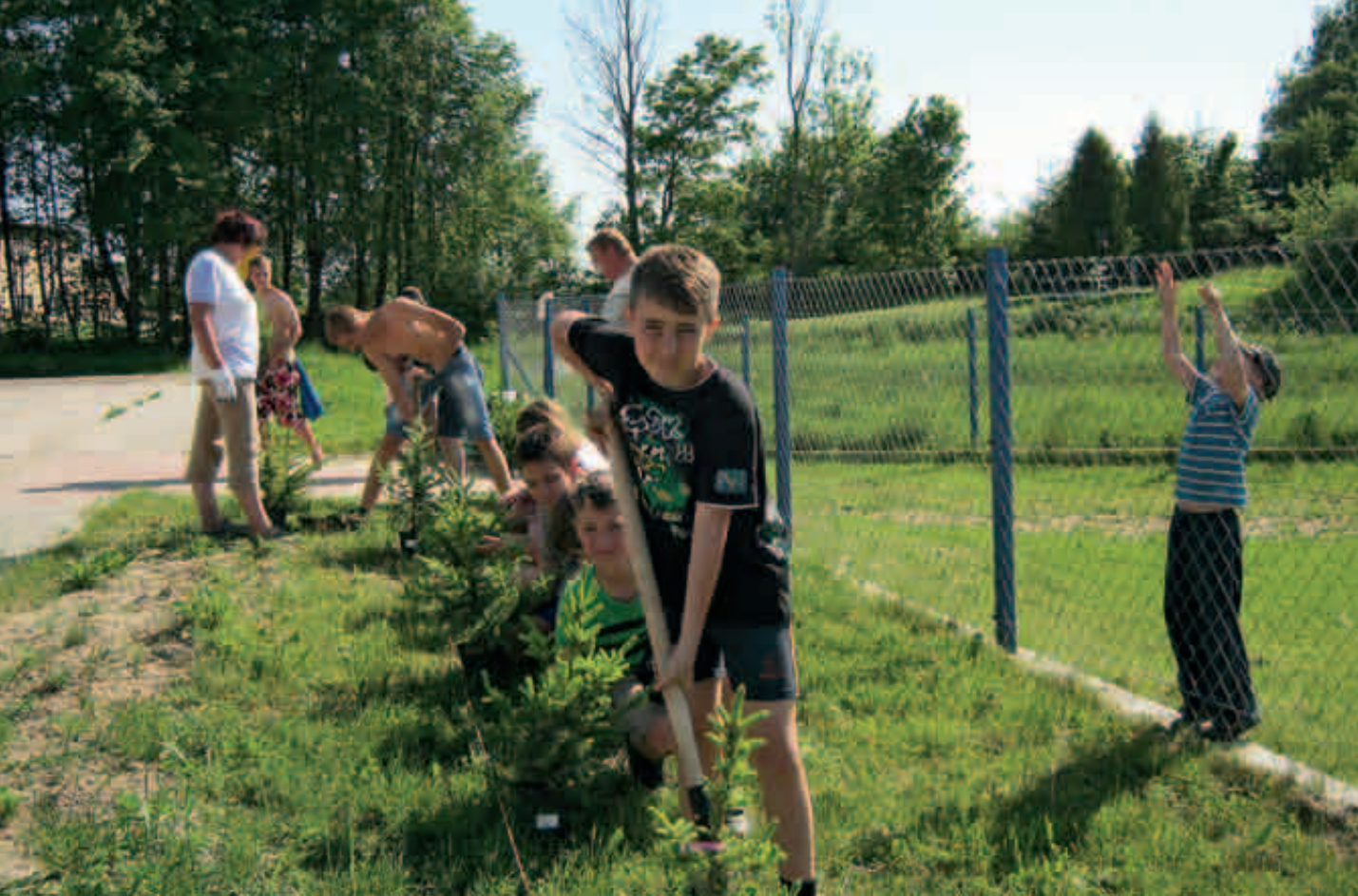
Szkola Podstawowa w Galwiciach Góldap.