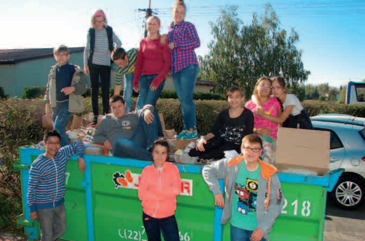
Zespół Szkół Podstawowych w Mrokowie