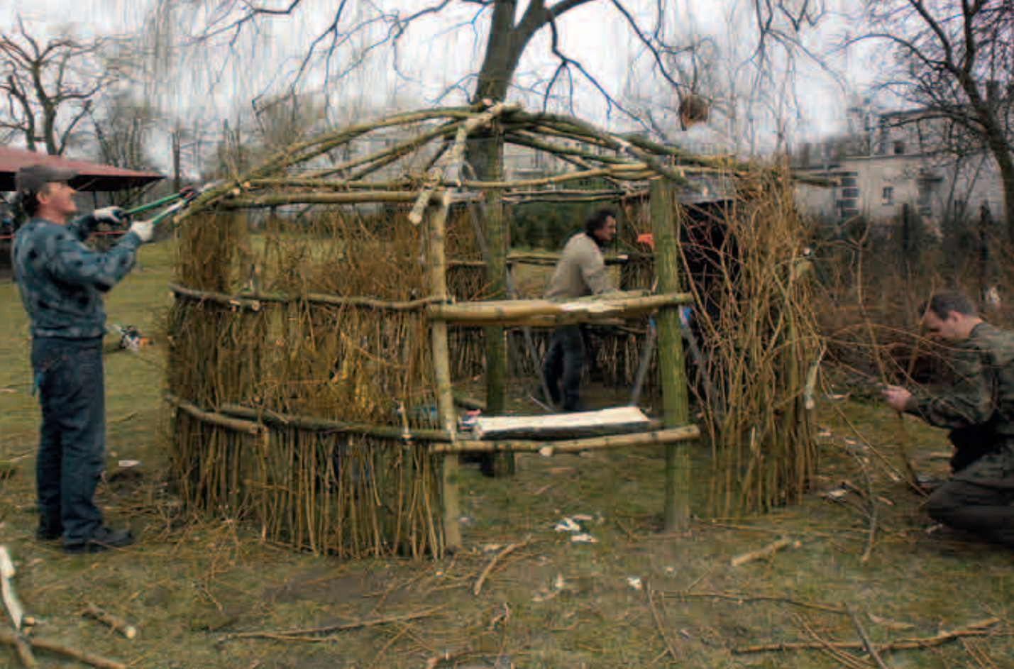
Przedszkole w Pawonkowie

Ekologii Uniwersytetu Śląskiego w Katowicach, który mówił na temat: Rośliny – niewyczerpany i niedoceniany skarb ludzkości . Pracownicy Zespołu Parków Krajobrazowych z Będzina przeprowadzili konkurs ekologiczny z nagrodami, a przedstawienie O czym szumią drzewa dały dzieci z Przedszkola nr 6.