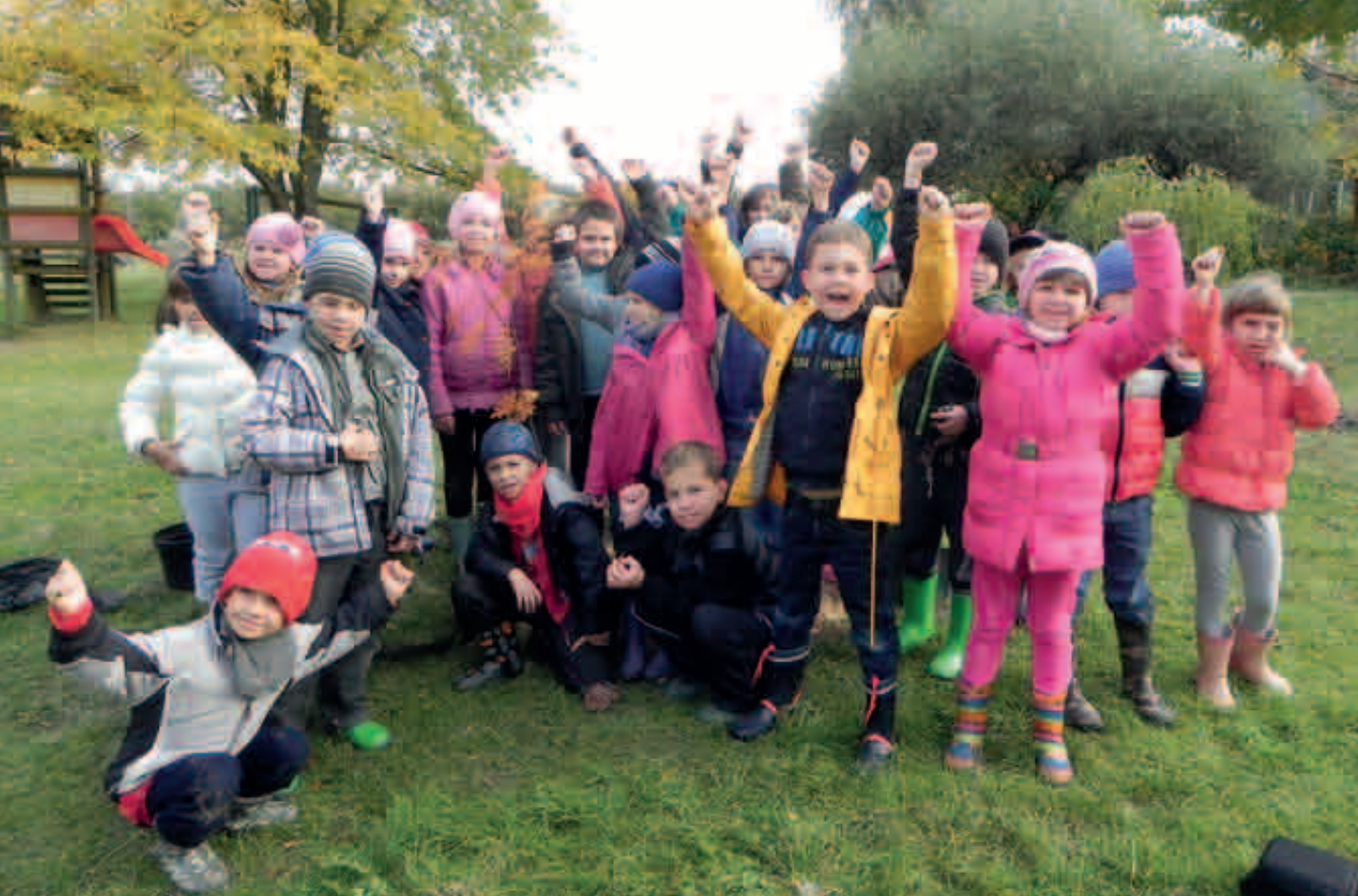
Stowarzyszenie ZIARNO w Słubicach

27 tysięcy sztuk sosny oraz 5 tysięcy brzoź na 3-hektarowej powierzchni gruntu. Gimnazjaliści wykonali ponadto plakaty oraz broszury informacyjne o lesie, przeprowadzili wywiady z leśniczymi na temat zasobów leśnych gminy i sąsiadujących gmin, przygotowali audycję szkolnego radiowęzła poświęconą znaczeniu lasów i ich ochronie, uczestniczyli w lekcjach o lasach i leśnych grach świetlicowych, w warsztatach i zajęciach w Ośrodku Edukacji Leśnej Nadleśnictwa Kielce oraz w siedzibie Świętokrzyskich i Nadnidziańskich Parków Krajobrazowych. Jakby tego było mało, do chwili podsumowania działań konkursowych młodzież zebrała około 300 kg makulatury.