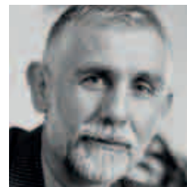
MACIEJ H. GRABOWSKI Minister Środowiska

To już 12. edycja Święta Drzewa. Jestem bardzo dumny, że możemy mówić w niej o 25 latach naszej wspólnej wolności. Sadźmy i opiekujmy się drzewami przez następne 100 lat w wolnej i demokratycznej Polsce.