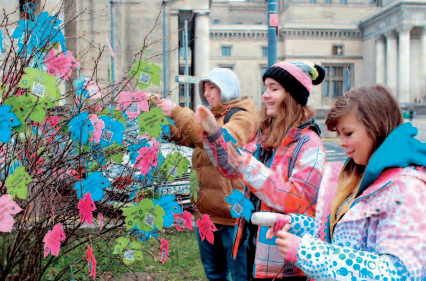
Happening Klubu Gaja. Każdy liść pochłania CO 2 w Warszawie.