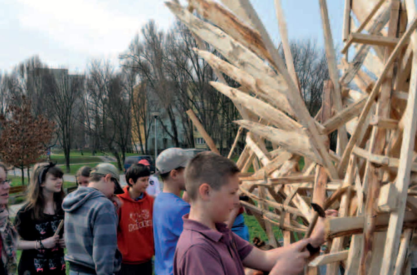
Szkoła Podstawowa nr 307 pomaga budować rzeźbę Pegaza Punkтови Przedszkolnemu Gapcio w Warszawie

wano uczniom 3 kategorie: zbiórka makulatury, ekologiczna ozdoba i wiosenna przekąska. Prace uczniów były sprzedawane na szkolnym kiermaszu.