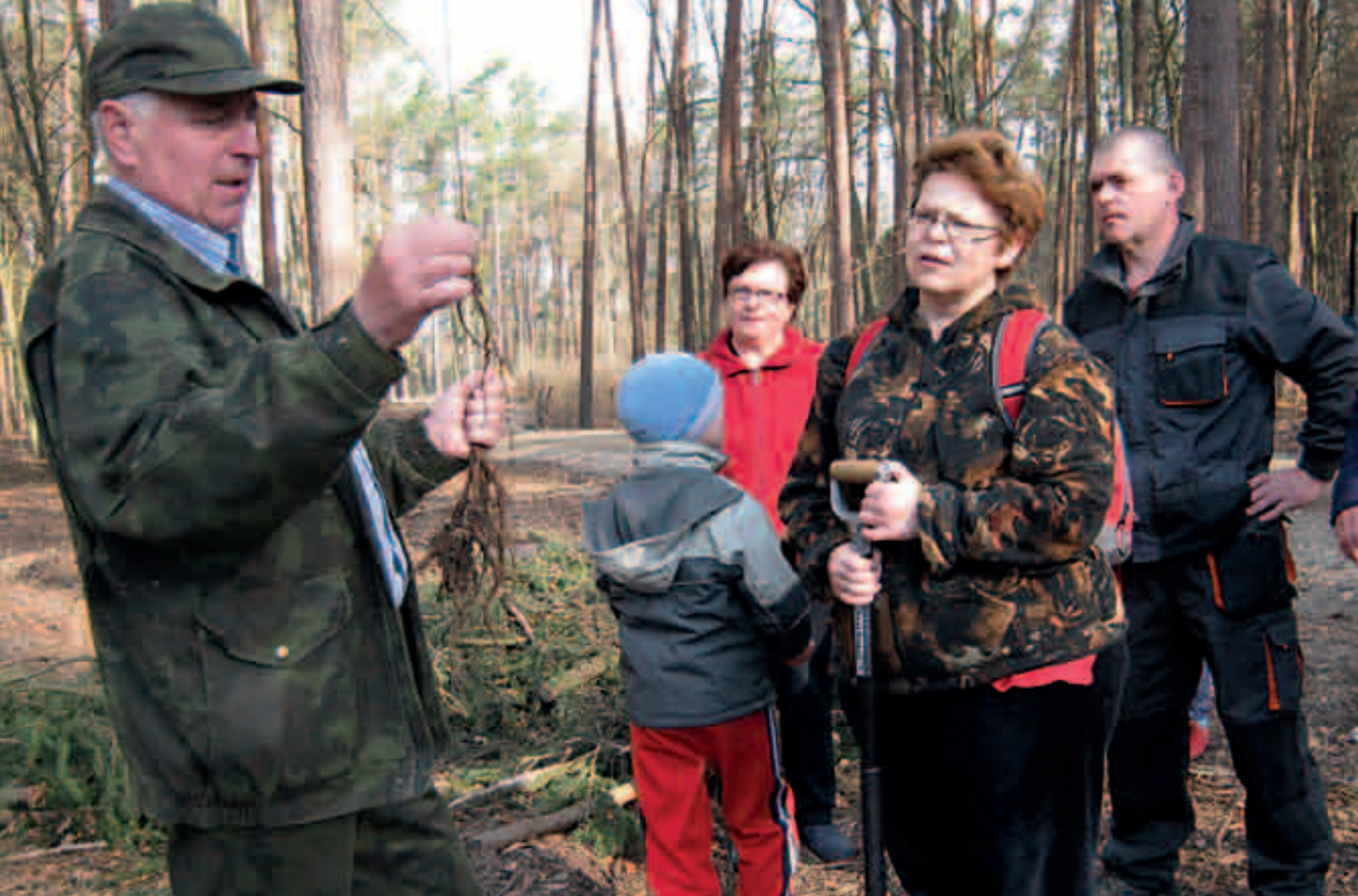
Zespół Szkół im. Jana Pawła II w Jamielniku w Nadleśnictwie Ilawa, Święto Drzewa 2013