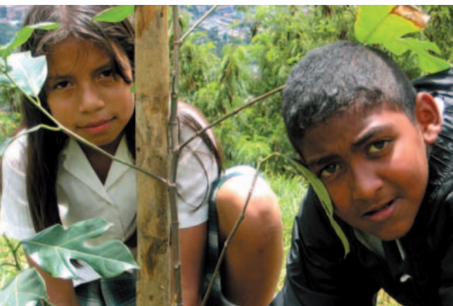
Sadzenie drzew w Kolumbii, Święto Drzewa 2005.

W ramach Święta Drzewa Klubu Gaja drzewa dla pokoju sadzono w 34 krajach świata, w Europie, Ameryce Południowej i Północnej, Azji i Afryce.