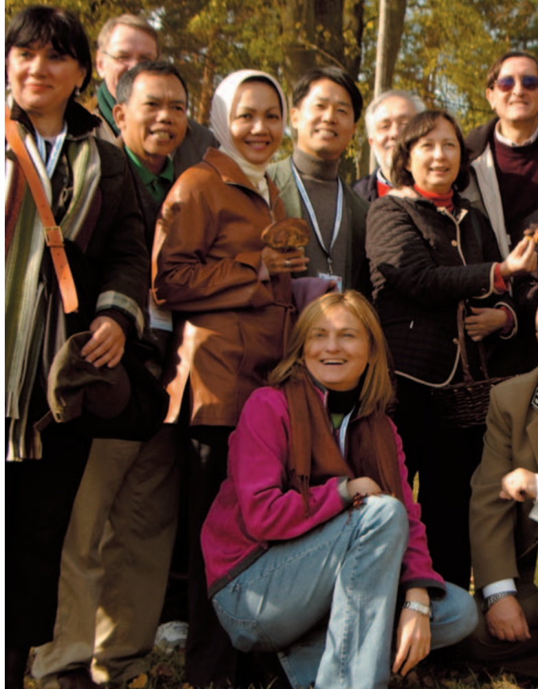
Szefowie misji dyplomatycznych w Nadleśnictwie Krynki, Święto Drzewa 2008.

W ciągu 25 lat, jakie upłynęły od odzyskania przez Polskę suwerenności, w niemal każdej dziedzinie naszego życia zaszły zmiany. Jednym z największych sukcesów naszej transformacji jest bezprecedensowa poprawa stanu środowiska naturalnego. Lasy są widocznym tego dowodem: wciąż nam ich przybywa i zajmują już prawie 30 proc. powierzchni kraju, zdecydowanie poprawił się ich stan zdrowotny, zwiększyło bogactwo przyrodnicze, bardzo skutecznie chronimy je przed różnymi zagrożeniami. Kondycja polskich lasów, ale też swoboda, z jaką możemy z nich korzystać, wyróżnia nas w Europie. Zapraszamy wszystkich do lasu, byśmy mogli razem cieszyć się wolnością, która w naturze jest od zawsze, a którą my odzyskaliśmy przed 25 laty.